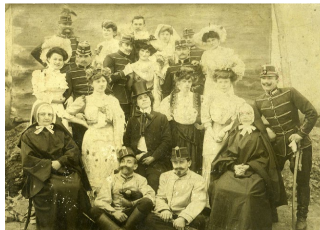
Ochotnický spolek Kolár při hře Mamzell Nitouche.