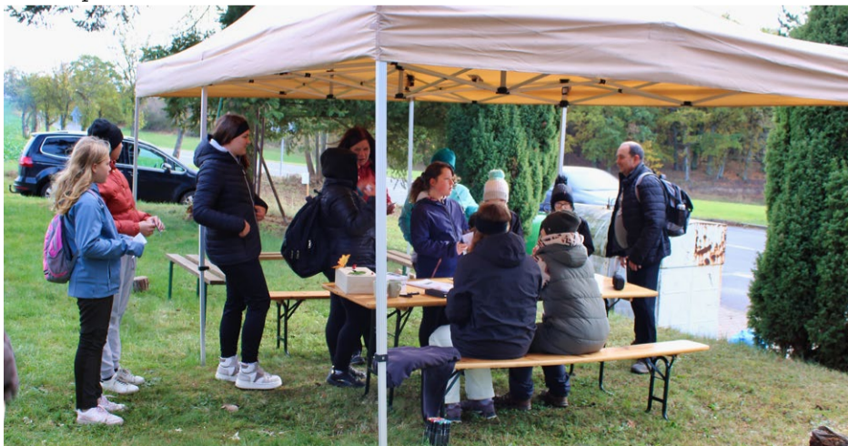
Prezentace účastníků v obci Trojany.