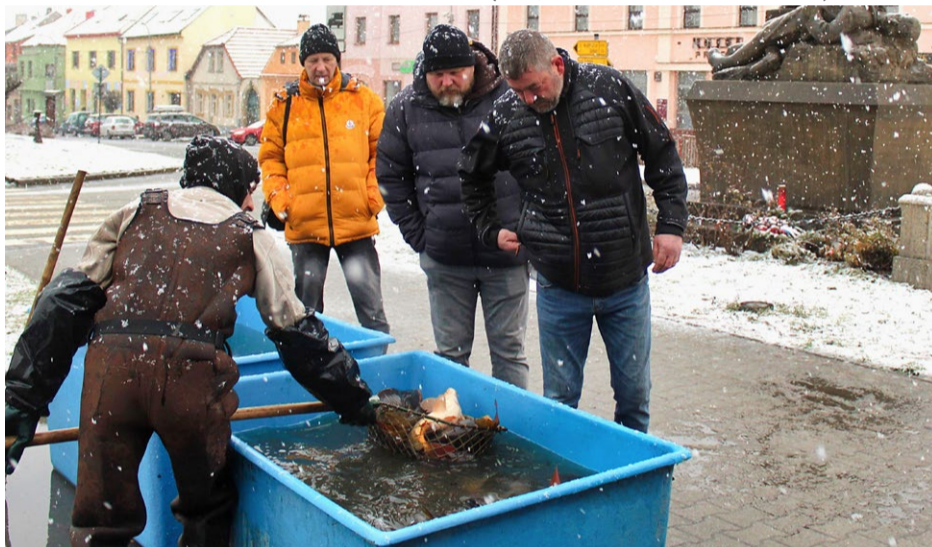
Tradiční prodej kaprů na Masarykově náměstí se letos uskuteční v sobotu 20. prosince.