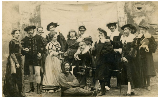
Ochotnický spolek Kolár v roce 1911. Sbirka muzea v Mariánské Týnici

spolku Kolár patřily v roce 1913 Staré hříchy a Dcery pana Zajíčka . Divadelní představení Žabec ale v roce 1915 sehrál již Červený kříž a mezi členy spolku byla ještě v roce 1918 odsouhlasena příprava hry Paní mincmistrová , která se ale neuskutečnila. Ochotnické