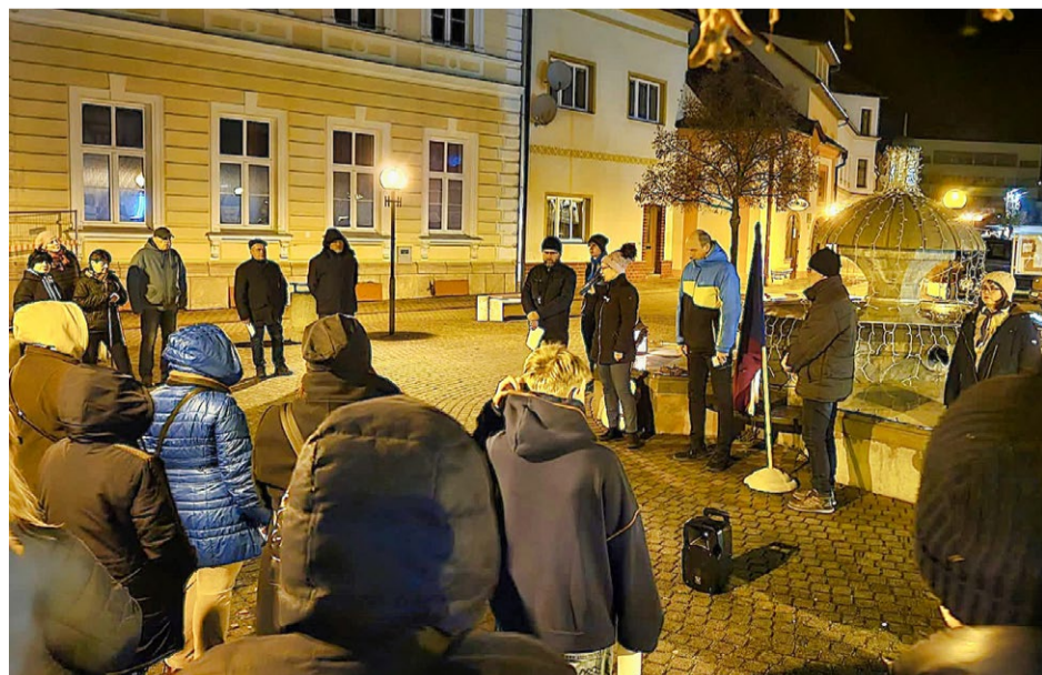
V pondělí 17. listopadu se na náměstí Osvobození konalo tradiční setkání Svíce pro svobodu, které zorganizovalo město Kralovice, římskokatolická farnost Kralovice a farnost Československé církve evangelické v Kralovicích. U státní vlajky drželi čestnou stráž členové kralovického střediska Junák. Všichni účastníci měli možnost poprosit o dar svobody a vzpomínat na významné dny naší historie spojené s uvedeným datem.