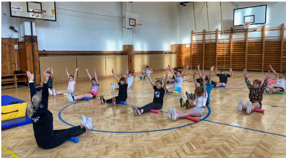
Pohybová logopedie při praktické ukázce.