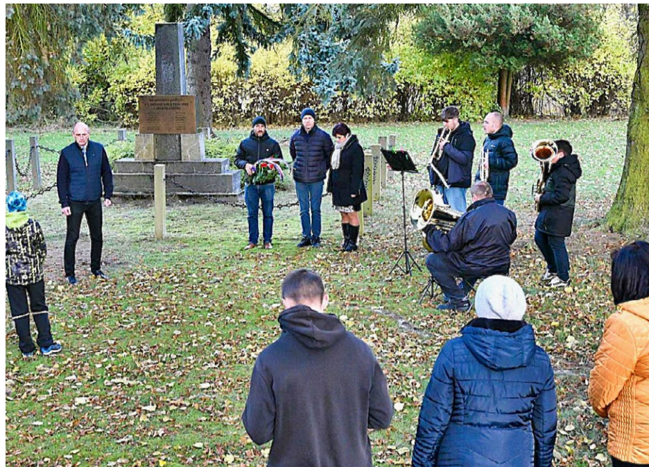
Ve čtvrtek 30. října se v Kralovicích a přidružených částech města uskutečnila pietní setkání k připomínce 107. výročí vzniku Československa a k uctění památky obětím I. světové války. U památníků v Hradecku, Trojaněch, Bukovině, Řemešíně i Kralovicích se sešli s místními občany členové rady města a zástupci osadních výborů. Státní hymnu zahrálo žesťové kvarteto ZUŠ Kralovice a u památníku na Masarykově náměstí stáli čestnou stráž členové kralovického střediska Junáka.

- Příkazní smlouvu pro provozování dobíjecího místa a sběr žádostí k Plzeňským kartám č. 393/2025/PDMP uzavíranou se společností Plzeňské městské dopravní podniky a.s. Předmětem žádosti je sběr žádostí o výměnu či vystavení nové Plzeňské karty včetně následného výdeje karet a dobíjení čipových nosičů.