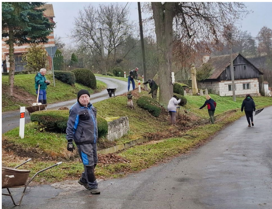
V neděli 16. listopadu se v obci Řemešín konal podzimní úklid. Organizátoři (osadní výbor a sbor dobrovolných hasičů) děkují všem zúčastněným za pomoc při akci.