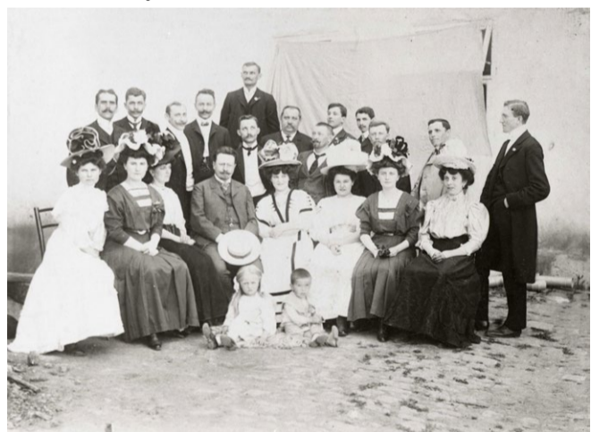
Kralovičtí ochotníci na konci 19. století. Sbirka muzea v Mariánské Týnici