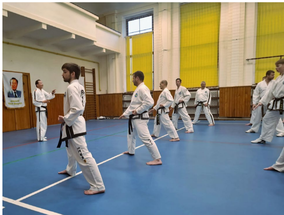
Pohled na taekwondisty při listopadovém semináři v kralovické sokolovně.