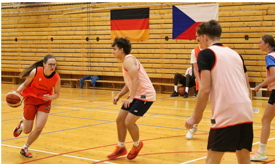
Ve dnech 8. a 23. listopadu proběhla dvě setkání mladých lidí z německého Neustadtu an der Waldnaab a Kralovicka (Kralovice, Plasy, Kozlany, Zihle atd.). Vedle basketbalových turnajů 3x3 (nejprve v Německu, poté v tělocvičně Gymnázia Plasy – viz snímek) byl náplní i kulturní a společenský program (muzeum v Neustadtu, kostel sv. Petra a Pavla v Kralovicích). Na setkání si našlo cestu vedení obou měst, celková účast vysoko přesáhla padesátku osob (hráči a hráčky, trenéři, řidiči, doprovod). Iniciátorem i zásadním finančním garantem projektu, který je dalším krokem k partnerství uvedených měst, byla německá strana.