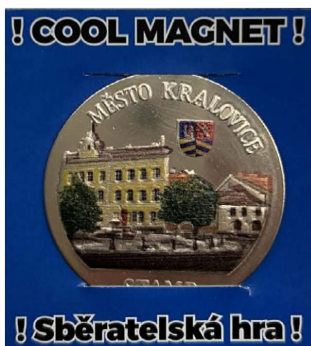
! Sběratelská hra !