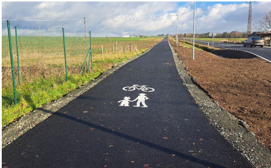
Na cyklo a pěší stezce mezi Kralovicemi a Kozlany jsou stavební práce hotovy. Kolaudace proběhne v lednu, slavnostní otevření stavby se uskuteční 15. dubna.