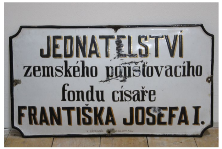
Informační tabule z domu čp. 90 ve sbírce Muzea v Mariánské Týnici.

V přízemí pod balkonem se nachází veliký vchod do obchodu, který tehdy patřil výše uváděnému Kovářikovi, což se lze dočíst na vývěsní tabuli nad vchodem. Před obchodem stojí skupinka osob a muž s rukama za zády v čepici může být majitel obchodu. Další tabule nás informuje o prodeji vína a nad bočním vchodem, který vede do průjezdu domu, je umístěna malá tabulka s nápisem