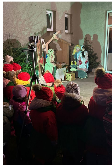
Silným zážitkem byla dramatizace betlémského příběhu v podání dětí ze speciální třídy, která připomněla pravý smysl Vánoc.