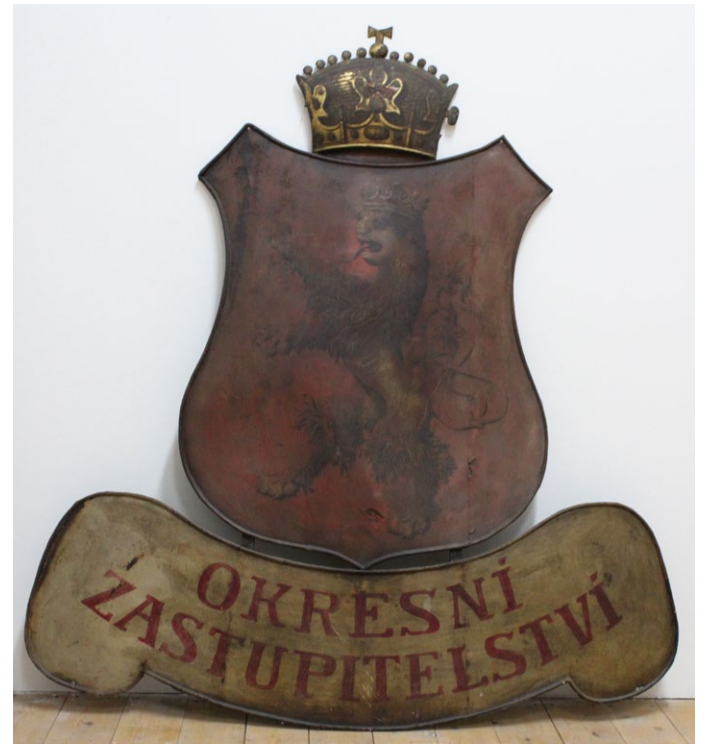
Vývěsní štít z Okresního domu před rokem 1918 ve sbírce Muzea v Mariánské Týnici.

Z doby před rokem 1898 nám podobu domu přibližuje fotografie části kralovického náměstí. Dům je jednopatrový, v patře se symetrickým členěním fasády, s centrálním vchodem na balkon, který je ohrazený železným zábradlím, na němž je umístěn vývěsní štít s českým lvem, korunou a nápisem „OKRESNÍ ZASTUPITELSTVO“.