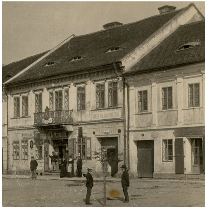
Dům čp. 90 před rokem 1898 s obchodem A. Kovářika.