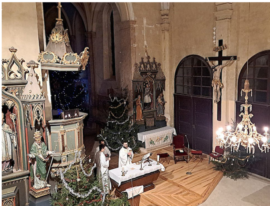
Ve středu 24. prosince se v kostele sv. Petra a Pavla v Kralovicích konala tradiční půlnoční bohoslužba.