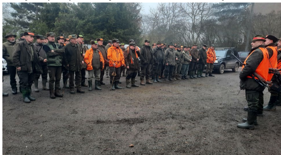
Slavnostní nástup před zahájením poslední leče.