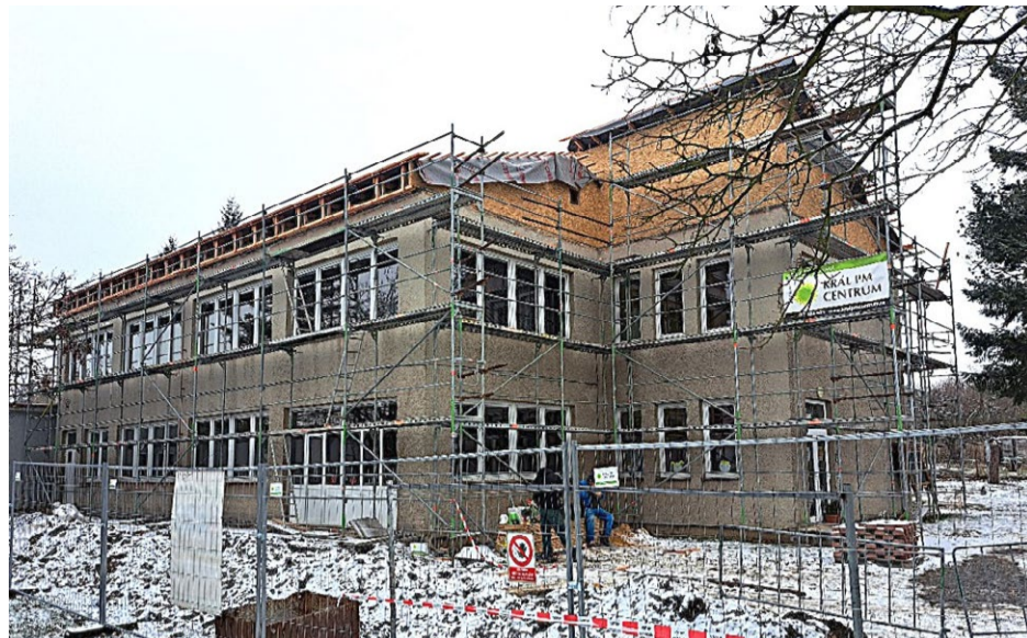
První etapa opravy střech v mateřské škole je také hotova, kolaudace se rovněž uskuteční v lednu.