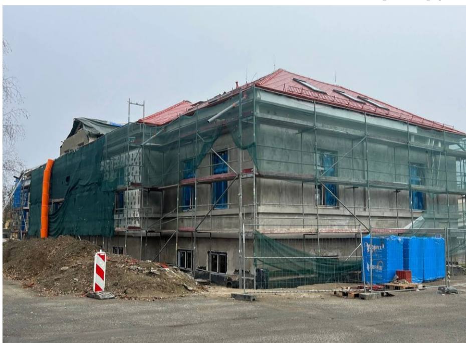
V areálu bývalých kasáren se přestavuje objekt č. 2 (dříve mj. kuchyňský blok) na dům dětí a mládeže. Část nákladů bude pokryta z dotačního titulu, realizace je plánována do června 2026.

V letošním roce by se měla uskutečnit rovněž druhá etapa rekonstrukce střeš v mateřské škole. V lednu bude zahájena oprava střešy a sociálního zařízení v Bukovině. V Řemešíně se počítá s vybudováním schodiště k pomníku padlým v I. světové válce, bude-li ovšem dotace, a s opravou spojovací