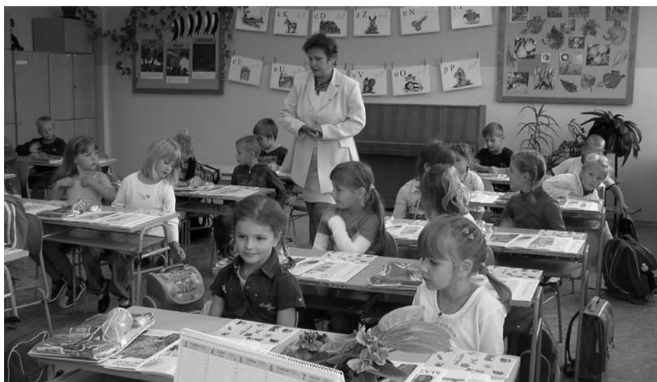
V pondělí 3. září byl slavnostně zahájen nový školní rok. Dveře základní školy se poprvé otevřely pro 47 prvňáčků. Nejen oni, ale i žáci 6. tříd se budou učit podle nového školního vzdělávacího programu „Učíme se pro život“, který pro ně po dobu dvou let připravovali jejich pedagogové. Základní vzdělávání má žákům poskytnout spolehlivý základ všeobecného vzdělávání orientovaného zejména na situace blízké životu na praktické jednání.

– vzala na vědomí inspekční zprávu o čtenářské gramotnosti žáků základní školy provedenou Českou školní inspekcí ze dne 22. května tohoto roku.