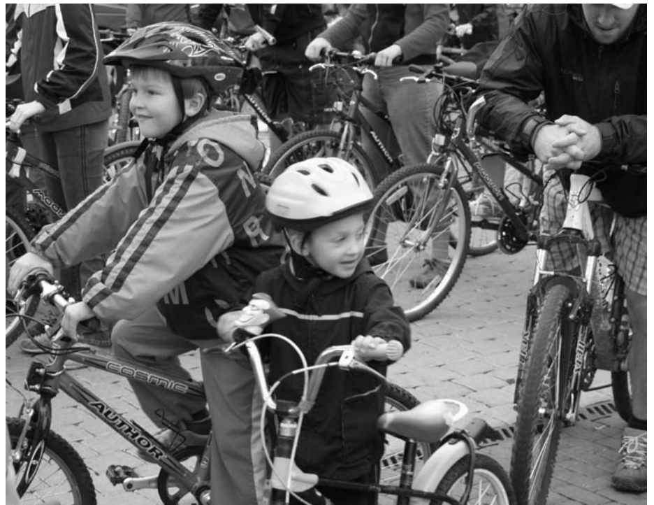
Pres jedenáct tisíc korun mezi sebou vybrali účastníci druhého ročníku Běhu Terryho Foxe v Kralovicích. Propagační akce zaměřenou na boj proti rakovině navštívilo 146 účastníků. Ti se vydali na pěší, běžecký či na cyklookruh. Všechny trasy měly start i cíl na náměstí Osvobození. Celkový výtěžek akce, jejíž organizaci měly na starosti DDM Kralovice a ZŠ Kralovice, činil 11 397 Kč.

Ještě před tímto úspěchem si zapsali kralovičtí závodníci nebyvalý triumf na domácím šampionátu štafet: v Nové Hradečné u Uničova vybojovaly kralovické trojice mužů i žen zlaté medaile, triumf severoplzeňské výpravy podtrhla ještě druhá sestava žen, které na čtvrté příčce chybělo k medaili patnáct vteřin.