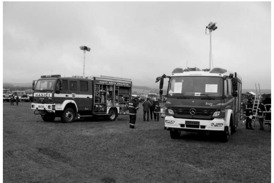
Zásahové vozidlo kralovických hasičů bylo součástí expozice firmy Ziegler ze SRN na setkání hasičských vozidel Pyrocar 07 v Příbryslavi 8. září tohoto roku.

např. cihlová drť prokazatelně urychluje proces samovznícení. Uhlí je třeba skladovat odděleně od ostatních paliv a vždy zvláště novou navážku od staré. V jeho blízkosti by neměly být umístěny zdroje tepla – rozvody trubek od topení, páry nebo teplé vody. Pozor také na manipulaci se zdroji otevřeného ohně (svíčka, cigareta, zapalovač) v blízkosti topiva. Pravidelně kontrolujte, zda nedochází k nárůstu teploty uvnitř uskladněného topiva. Pokud zjistíte, že se teplota výrazně zvýšila (za kritickou mez je považováno 65° C), uhlí přeházejte nebo přenechte na volné místo, kde ho uskladněte do vrstvy vysoké maximálně několik desítek cm a nechte ho vychladnout. Pokud již dojde k požáru sazí v komíně, je nutné urychleně odstranit veškerý hořlavý materiál z blízkosti komínového tělesa. Hořící saze nikdy nehaste vodou, jelikož by mohl komín popraskat. Hasiči k uhašení a sražení hořících nebotnajíících sazí používají zejména suchý písek. Každý požár bez odkladu ohlaste hasičům na linku 150 nebo 112. Hasiči Kralovice