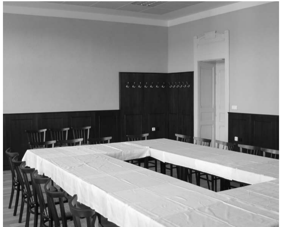
Rekonstrukce zasedací síně v budově radnice je dokončena. Postupovalo se úsporně – část nového vybavení vznikla renovací starého mobiliáře. Výsledek je přesto velmi uspokojivý.