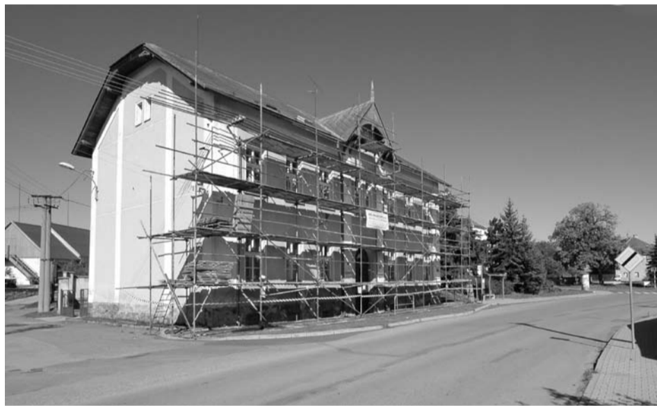
Na budově Základní školy praktické byly zahájeny rekonstrukce venkovních omítek. Oprava si vyžádá náklad 550 000 Kč. Práce provádí firma Král PM centrum, s. r. o.

Prakticky několik posledních let se tedy u těchto stromů stále čeká na jakýsi zázrak – že se stromy obalí listy, koruny zhoustnou a vyraší nové větve. Tak se ale neděje a ani už patrně