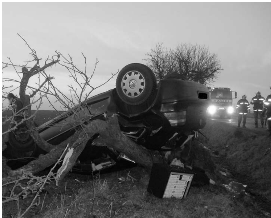
Kralovičtí hasiči zasahovali i při dopravní nehodě u Kozojed 11. ledna letošního roku. Řidič a spolujezdkyně utrpěli po nárazu do stromu středně těžká zranění.

V posledním období vyjžděli záchranáři k několika případům, kdy se lidé díky vlastní neopatrnosti propadli ledem do vody. Vzhledem ke vzrůstajícímu počtu těchto nehod přinášíme několik rad, jak se v takovém případě zachovat.