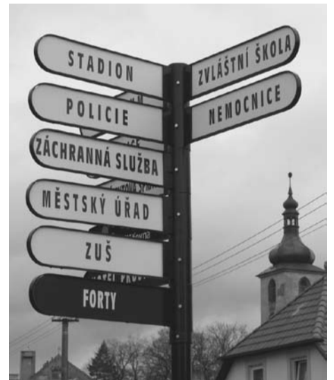
Rada města schválila převzetí II. etapy orientačního systému města Kralovice od firmy Reklama Fryček za cenu 134200,- Kč. Nové ukazatele doplní stávající značení, které je určeno návštěvníkům Kralovic a odkazuje na všechny důležité úřady a instituce, využíváno je i k reklamním účelům.