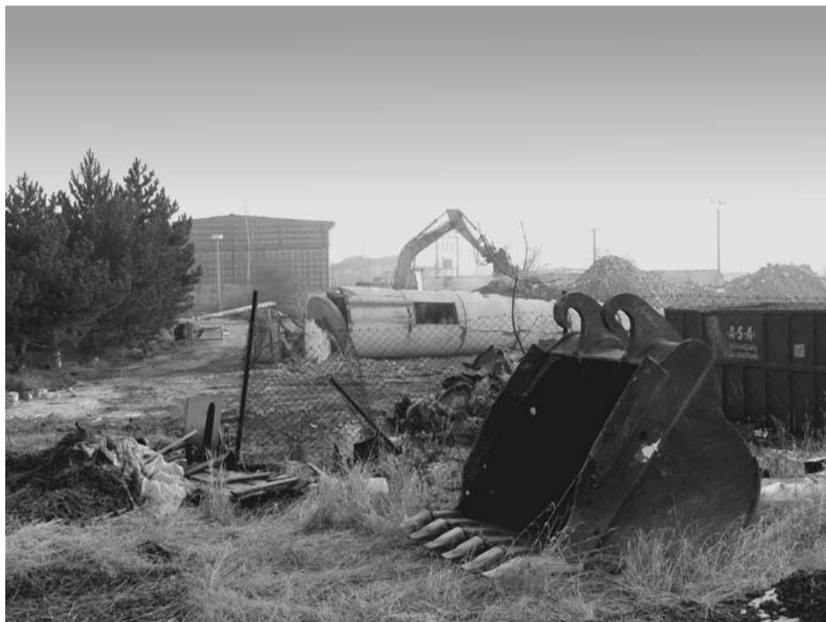
Na Výsluní pokračuje demolice bývalé kotelny, na jejímž místě vznikne diskontní prodejna potravin.

Výše poplatku se řídí ustanovením Obecně závazné vyhlášky města Kralovice č. 3/2004 ze dne 15. prosince 2004, kterou se mění a doplňuje obecně závazná vyhláška č. 1/2003 o místních poplatcích. Sazba poplatku pro poplatníka činí 450,- Kč. Město Kralovice poskytuje podle usnesení zastupitelstva města Kralovice č. 149/2004 ze dne 15. 12. 2004 příspěvek na tento poplatek pro vícečlenné rodiny, a to pro prvního občana mladšího osmnácti let ve výši 100,- Kč, pro druhého občana mladšího osmnácti let ve výši 200,- Kč. Příspěvek bude poskytnut při úhradě poplatku a nebude přiznán poplatníkům, kteří úhradu celé sazby poplatku dle výše uvedené obecně závaznou vyhláškou neprovedou v daném termínu.