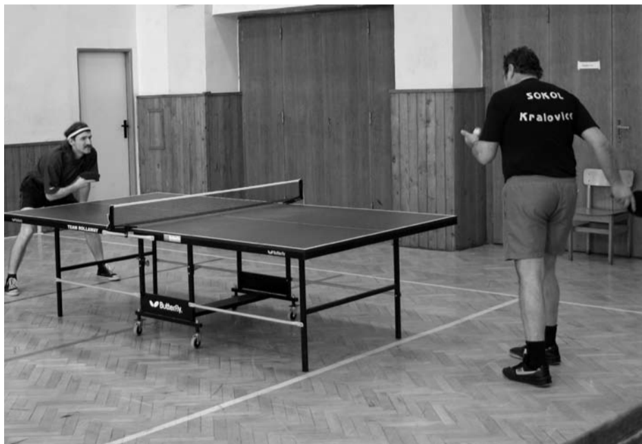
Stolní tenisté zahájili poslední lednový víkend druhou polovinu dlouhodobých soutěží mužů. B tým hostil běčko a céčko Vejprnic (na snímku).