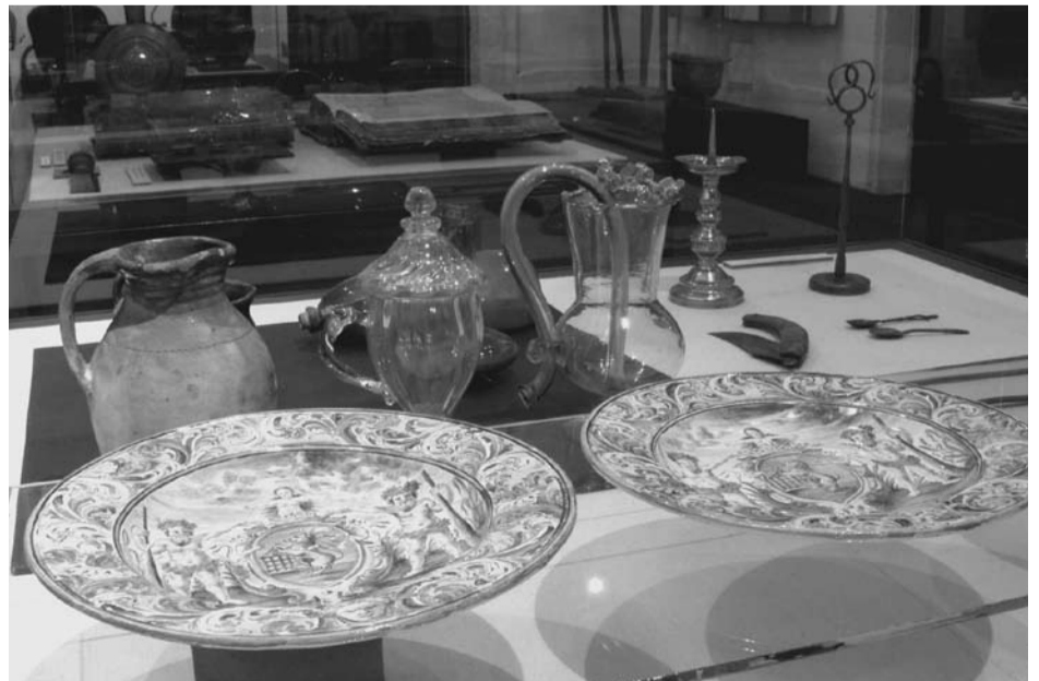
Z expozice okresního muzea v Mariánské Týnici.

Muzeum a spolupořadatelé kulturních akcí se těší, že i letošní nabídka se setká se stejným zájmem veřejnosti, jako v letech minulých.