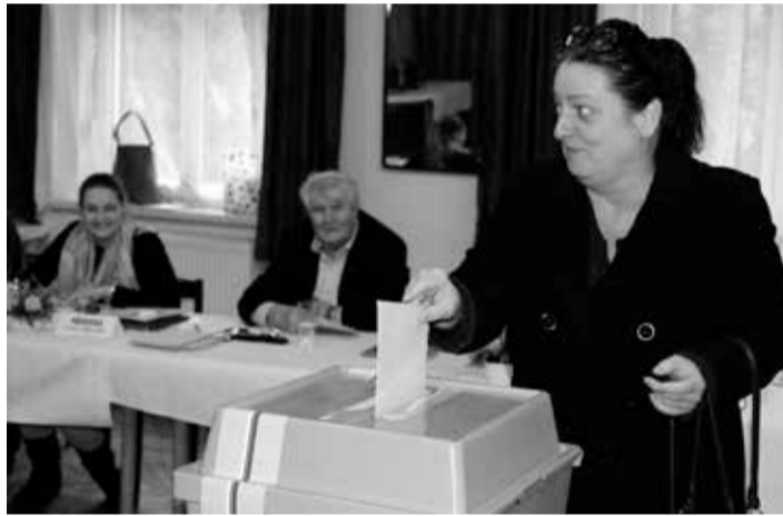
V Kralovicích a přidružených obcích se volilo v šesti okrscích – na snímku záběry z Lidového domu (vpravo) a Střední školy Kralovice.