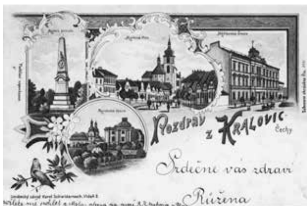
Pohlednice vydaná firmou Karel Swidernoch, digitální archiv muzea v Mariánské Týnici.