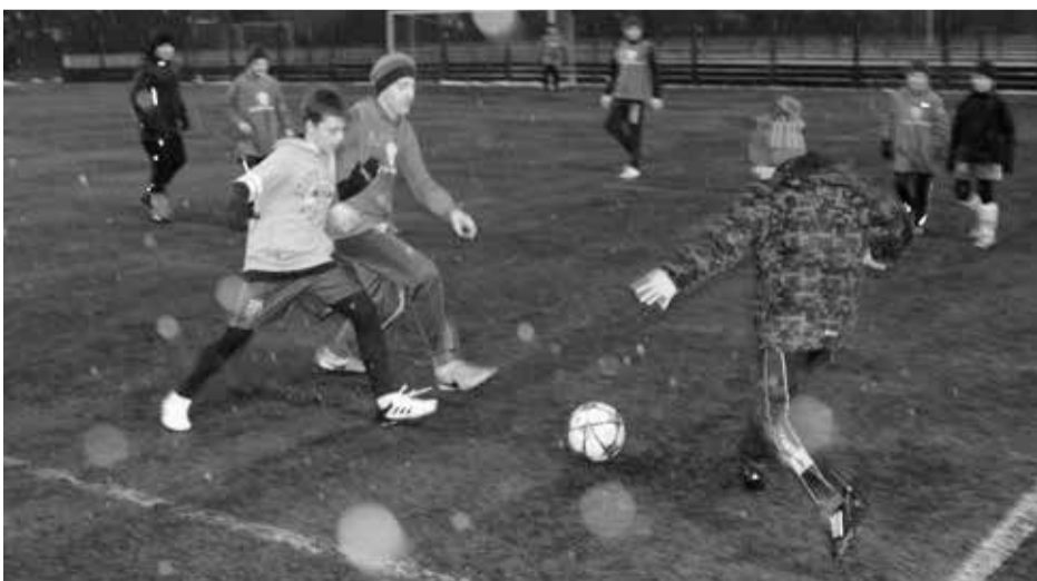
Fotbaloví mladší žáci sehraji ve čtvrtek 18. ledna na umělé trávě za základní školou přátelský duel s Hadačkou (snímek). V hustém dešti přípravné klání prohráli 1:5.