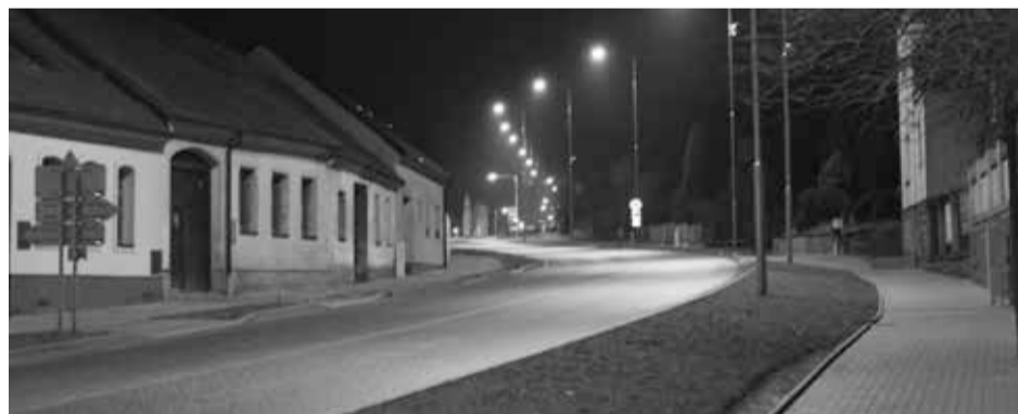
Přes všechny těžkosti při rekonstrukci Žatecké ulice (viz foto), kde se jednalo i o opravu vodovodního řádu, je výsledek velmi dobrý, byť pro pokladu města šlo o značný výdej. Ještě se bude dokončovat vjezd do hasičárny, oprava schodiště do Sadové ulice, zelená a okolí bývalé slévárny.