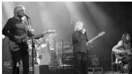
V úterý 23. ledna vystoupil v kralovickém Lidovém domě Václav Neckář se skupinou Bacily.