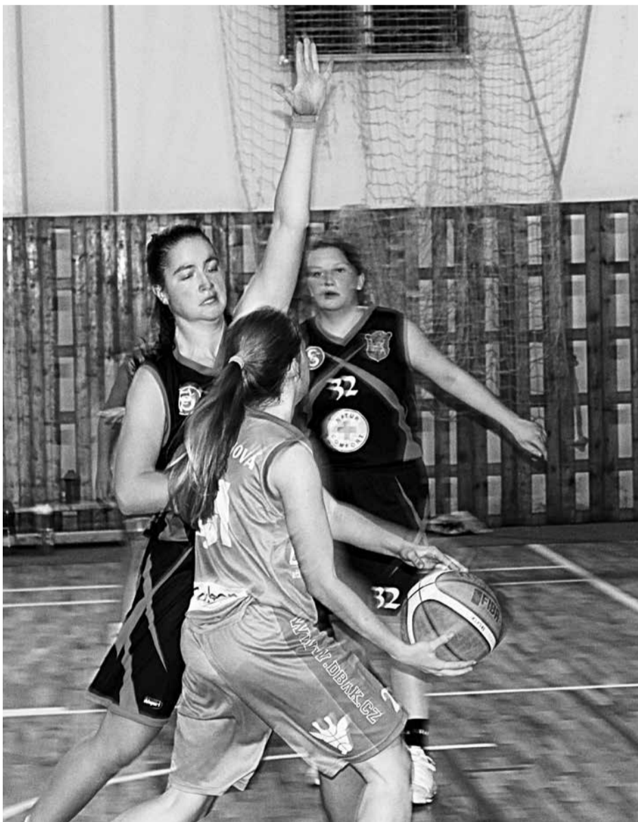
Basketbalové kadetky DBaK Kožlany/Kralovice/Plzeň podlehly v ligovém klání v kožlanském tělocvičném celku Klatov 63:75.

V zimním období se bohoslužby konají na faře (vstup kostelem).