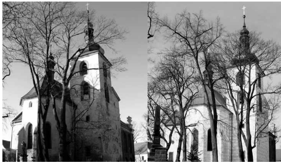
Kostel sv. Petra a Pavla z roku 2009 a v nynější podobě.

Členové spolku vypracovali pro Římskokatolickou farnost Kralovice několik úspěšných žádostí o dotace z Programu rozvoje venkova Ministerstva zemědělství: v roce 2011 „Zpřístupnění hrobky rodu Gryspeků v kostele sv. Petra a Pavla v Kralovicích“, v roce 2012 „Restaurování renesanční malované výzdoby v kapli kostela sv. Petra a Pavla v Kralovicích“, v roce 2014 „Expozice rodu Gryspeků v kapli kostela sv. Petra a Pavla v Kralovicích“. Úspěšná byla i žádost na dotaci projektu „Restaurování práce v kapli Nejsvětějšího srdce Páně v kostele sv. Petra a Pavla v Kralovicích“ (restaurování výmalby a epitafu), kterou jsme mohli podat do Česko-německého fondu budoucnosti díky našim kontaktům s rodinou Griessenbeck, vzdáleným příbuzným českých Gryspeků, kteří byli našimi partnery na německé straně. V roce 2014 se nám podařilo získat dotaci z Dispozičního fondu Programu přeshraniční spolupráce Česko – Bavorsko na projekt „I. etapa úpravy mikroklimatu v hrobce Gryspeků“.