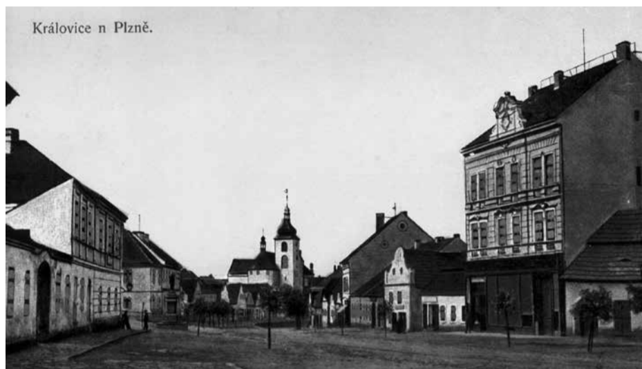
Pohlednice z let 1905–1908 s obchodním domem Popper

je jednopatrová a na jejím průčelí otočeném do náměstí je sedm okenních os, v přízemí hlavní vchod lemovaný kamenným ostěním a pohledově zcela vpravo je další vchod do obchodu s otevřenými dvoukřídlými vnějšími dveřmi. Na průčelí otočeném do Markovy ulice jsou na této budově dvě okenní osy. Na ní pak navazuje přístavba z let 1851–1852, která je na jedné verzi pohlednice dokonce barevně odlišena a na všech je patrná jiná výška oken i odsazení střechy od hlavní budovy. Za radnicí se zvedá budova bývalé spořitelny postavená v roce 1908 a dále navazuje průhled Markovou třídou ke kostelu.