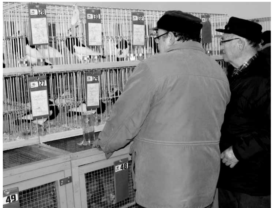
Zimní prodejní výstava drobného zvířectva se uskutečnila v areálu kralovické organizace Českého svazu chovatelů potříapadesáté. Od 9. do 11. února navštívilo areál během víkendu 1074 dospělých a 138 dětí, k tomu navíc bezplatně zájemci z kralovických škol. Dvaadvacet vystavovatelů předvedlo 129 kusů vodní a hrabavé drůbeže, 238 králiků, 428 holubů a 210 exotických ptáků.