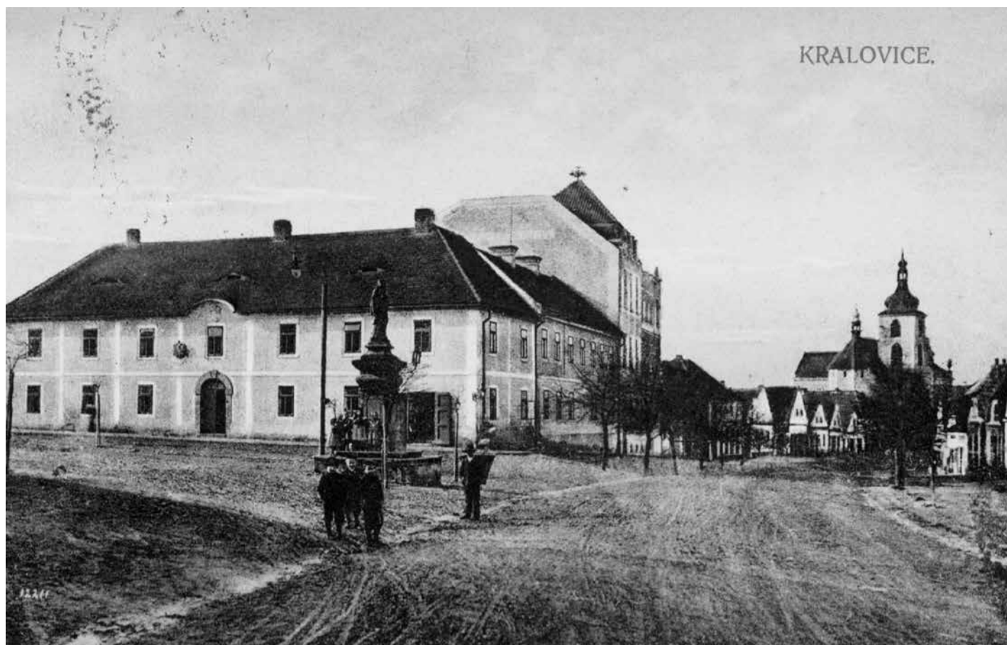
Pohlednice z let 1908–1918 s kralovickou radnicí

Zajímavý je pohled na bývalou kralovickou radnici použitý na třech verzích pohlednic lišících se v nepatrných detailech v provedení textu a barevnosti. Snímku dominuje socha sv. Jana Nepomuckého, před níž stojí několik postav a pozadí vyplňuje původní radnice. Ze záběrů je zřejmé, že stavba má dvě odlišné části. Hlavní budova