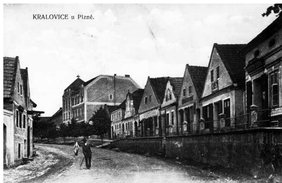
Pohlednice z 20. let 20. století – Markova ulice