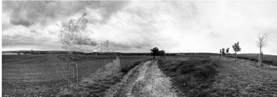
Panoramatický snímek – pohled na Šustrák.

Kralovice – V sobotu 23. listopadu se uskuteční veřejná výsadba stromořadí při nově obnovované cestě ze Šustráku k Voleskému rybníku. Dojde tak k uskutečnění jednoho z hlavních cílů, který si dal při svém založení Okrašlovací spolek Kralovice, totiž obnovu zaniklých historických cest. Realizace obnovy cesty je možná díky spolupráci s městem Kralovice a společností Kralovická zemědělská, a.s. Vznikne tak přímá pěšina z Kralovic přímo k Volesku, kde nikomu nebude hrozit střet s motorovým vozidlem.