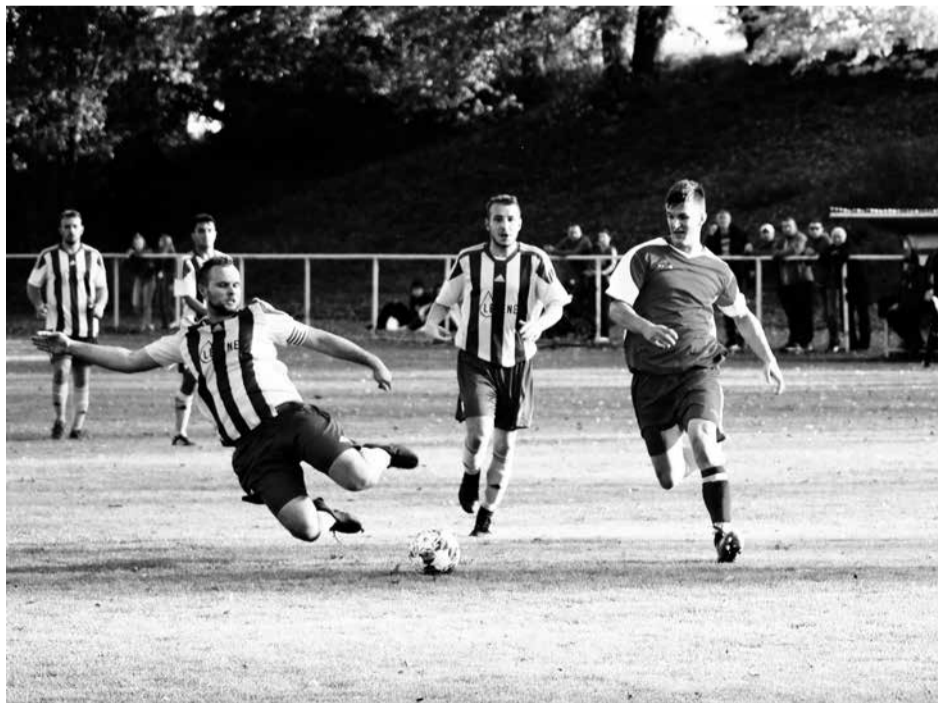
Duel fotbalistů kralovického áčka (v pruhovaném) a celku Kaznějova skončil vítězstvím hostů 2:0.

Republikové kolo (17. 10., Hradec Král. – Stříbrný rybník) – st. žáci: 8. místo (14 týmů); 5. A. Urbánek, 34. J. Špiroch, 40. F. Buchtelík, 42. D. Sládek, 61. O. Pech, 65. J. Zeman). (rč)