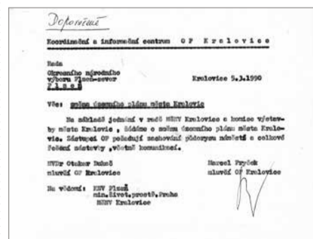
Kopie dopisu zasláná Koordináčním centrem OF Kralovice 9. března 1990 na ONV Plzeň-sever. Obsahem dopisu je žádost o zachování původního půdorysu náměstí, které se mělo bourat.

lohorského šlechtice, který se zasloužil o povýšení Kralovic na město. „Improbis labor omnia vincit“ (vytrvalá práce všechno překoná) – heslo Floriána Gryspeka přenesené z jedné z jeho medailí na gryspekovský památník, které je užíváno jako motiv činnosti Spolku Gryspek, je pro všechny závazkem do budoucnosti. (ts)