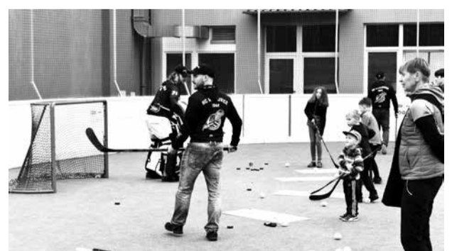
Galerii snímků ze dne otevřených dveří