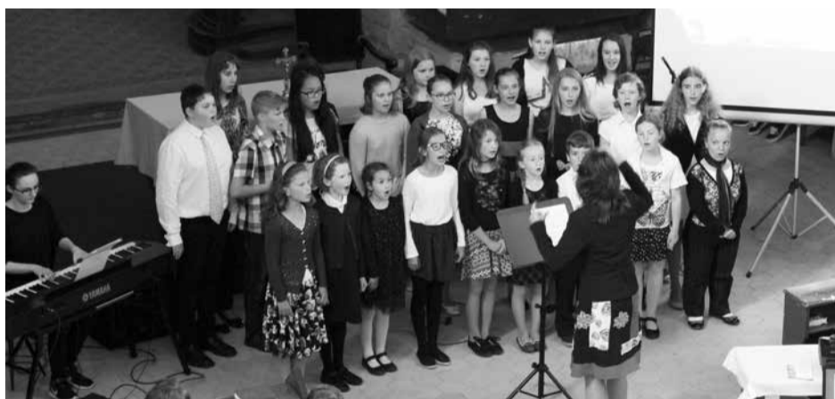
Tradiční Noc kostelů z pátku 25. na sobotu 26. května přilákala množství zájemců k návštěvě kostela sv. Petra a Pavla (dolní foto) i evangelického kostela (nahore). Podrobnější informace přineseme v červencovém čísle.