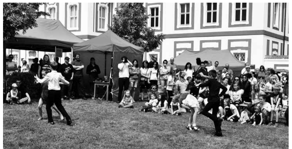
Májový den uměleckých řemesel a divadla proběhl v sobotu 19. května v areálu Muzea a galerie severního Plzeňska v Mariánské Týnici. Bohatá divácká návštěva shlédla řadu vystoupení žáků kralovických škol a dalších organizací.