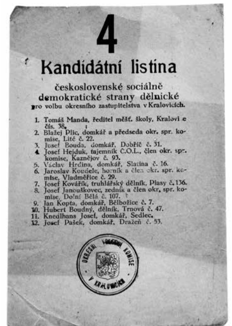
Hlasovací lístek pro volby do okresního zastupitelstva z roku 1928.

K roku 1928 v Kralovicích přidejme ještě malou kuriozitu. 8. května 1928 se zde totiž zastavil na své pouti kolem světa Edmond