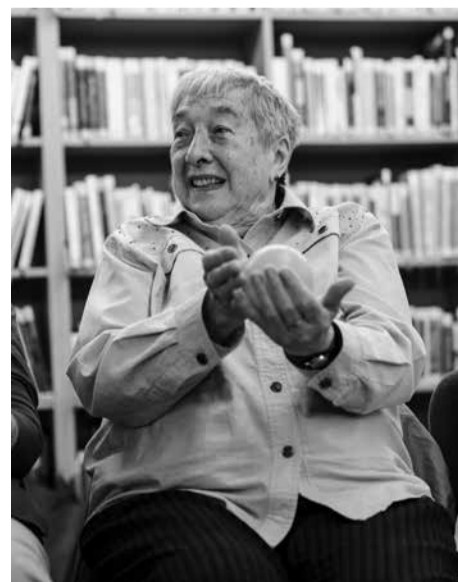
Při psychomotorickém workshopu Cirkus Senior v kralovické knihovně si zájemci měli možnost vyzkoušet základy žonglování s míčky, kruhy a talíři.