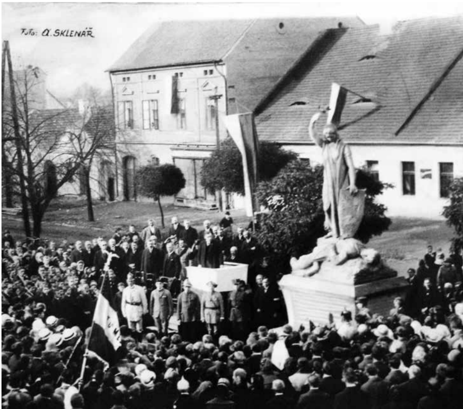
Slavnost deseti let trvání Československé republiky v roce 1928.