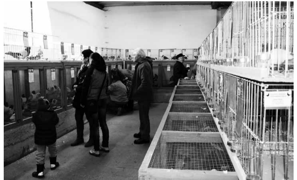
Jednu z nejprestižnějších akcí Základní organizace svazu chovatelů Kralovice je každoroční únorová výstava.