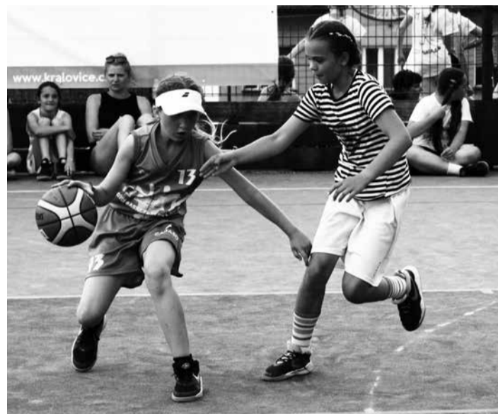
Streetbalový Memoriál Katky Šlikové proběhl v Kozlanech po roční pauze v sobotu 19. června.