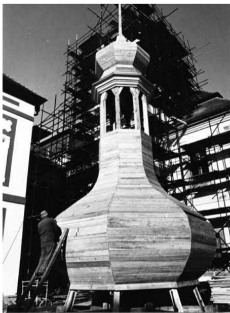
Konstrukce východní věže před osazením 1993

Rekonstrukce kostela Zvěstování Panny Marie v Mariánské Týnici u Kralovic pokračovala v roce 2000 obnovou kamenné lucerny nad centrální kupolí. Nad dokončenou dvouplášťovou zděnou klenbou kupole byla vyzděna kamenná lucerna o váze circa 80 tun. Zcela jedinečná obnova této části spočívala v průzkumu dochovaných fragmentů lucerny, sestavené po zřízení kupole a umístění dlouhodobě v nádvoří muzea, dále v zaměření a posouzení stávajícího stavu originálních kamenných bloků. Původní kamenné bloky byly restaurovány a nedochované části