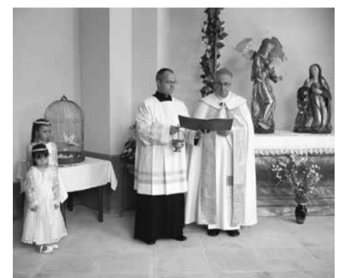
Žehnání první kaple východního ambitu 22. června 2012

rací, která vedla k úplné rehabilitaci jedinečné památky západních Čech. Jednotlivci, spolky, instituce, katolická církev a orgány památkové péče i státní správa a samospráva spojení ušlechtilým cílem zde prokázali příkladnou angažovanost na organizaci obnovy, již se účastnili přední architekti, projektanti, historici umění, restaurátoři, umělci a řada odborných řemeslných profesí. Výstava je pouze skromným připomenutím a hlubokým poděkováním za práci všech, kteří přispěli k druhému životu Mariánské Týnice. Její výsledek zůstává trvalou památkou a vzorem pro generace budoucí. Má daleko větší hodnotu, než byly náklady, které celkem dosáhly výše 56 milionů korun, z nichž 13 milionů uhradil Plzeňský kraj a 43 milionů pak Evropská unie a státní rozpočet. Projekt zahrnoval kromě stavby ještě doprovodný časosběrný dokument, který natáčela po tři roky režisérka Marie Šandová. Jeho výsledky je možné shlédnout na internetu (odkaz na webových stránkách muzea v Mariánské Týnici). Pět dílů dnes dokládá cestu od archeologického průzkumu staveniště na východní straně Mariánské Týnice přes slavnostní okamžiky projektu až do finále, kdy 5. června roku 2021 byla stavba předána veřejnosti za přítomnosti kralovického starosty ing. Karla Popela, který dostal symbolický