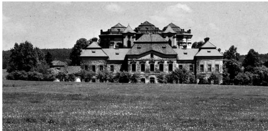
Pohled na areál M. Týnice od jihu z r. 1989.

30 m 3 kamenných bloků, které byly vytesány z polského pískovce z lokality Radkov neda-leko Náchoda. Ten vyhovoval požadavkům na kvalitu a odolnost kamene, jenž měl podobnou strukturu a barevnost jako původní potvorovský pískovec. Zdejší lom byl již po desetiletí mimo provoz, a tak bylo rozhodnuto využít kamenolomu v Polsku. Kamenné bloky byly dopravovány do výšky přes 30 m na místo za pomoci speciálního důmyslného zařízení. Na kamenné lucerně byla původně