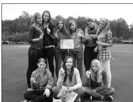
Pohár rozhlasu, žákyně 8.-9. tříd okresní kolo – 3. místo