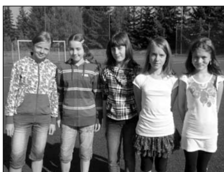
Orientační běh, žákyně 4.-5. tříd krajské kolo – 1. místo