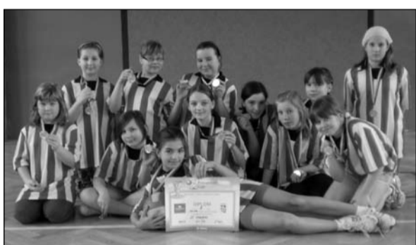
Vybíjená, žákyně 4.-5. tříd okresní kolo – 1. místo krajské kolo – 5. místo