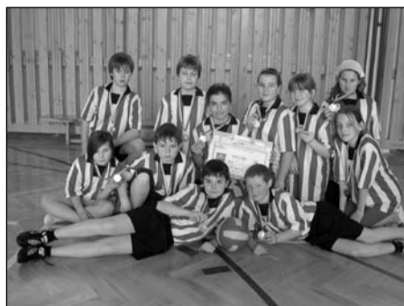
Vybíjená, žáci a žákyně 4.-5. tříd okresní kolo – 3. místo