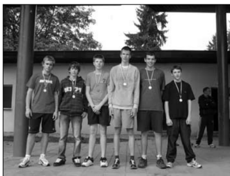
Přespolní běh, žáci 8.–9. tříd okresní kolo – 2. místo