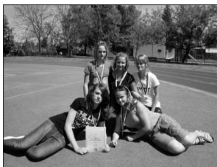
Atletický čtyřboj, žákyně 6.-7. tříd okresní kolo – 1. místo