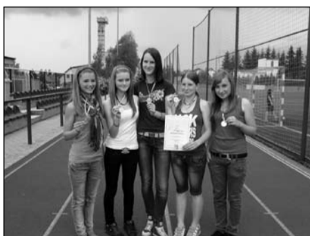
Atletický čtyřboj, žákyně 8.-9. tříd okresní kolo – 1. místo krajské kolo – 6. místo