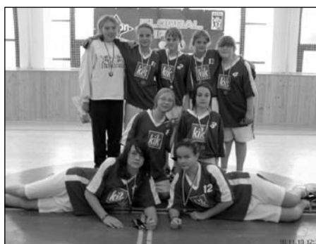
Florbal, žákyně 6.-7. tříd okresní kolo – 3. místo