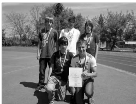
Atletický čtyřboj, žáci 6.-7. tříd okresní kolo – 1. místo