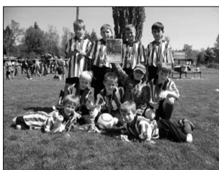
McDonald's Cup, žáci 1.-3. tříd okresní kolo – 2. místo