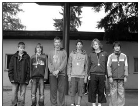
Přespolní běh, žáci 6.–7. tříd okresní kolo – 1. místo krajské kolo – 5. místo