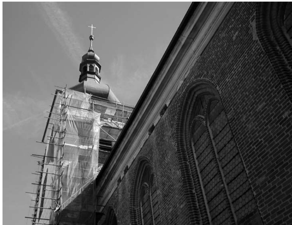
Lešení opět obklopilo věž farního kostela sv. Petra a Pavla. Po loňské rekonstrukci její severní strany bude oprava pokračovat, pravděpodobně finanční prostředky z Programu zachrany architektonického dědictví Ministerstva kultury postačí i na opravu fasády na části presbyteria.

se sejde na svém dalším pravidelném zasedání ve středu 14. září v 18 hodin v Lidovém domě. Zveme všechny občany.