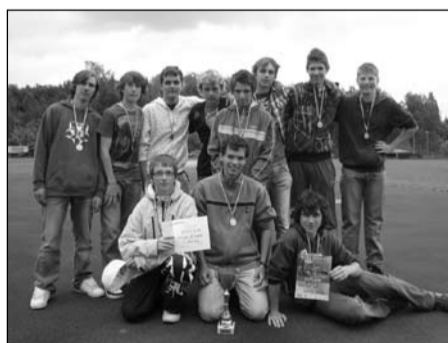
Pohár rozhlasu, žáci 8.-9. tříd okresní kolo – 1. místo krajské kolo – 5. místo