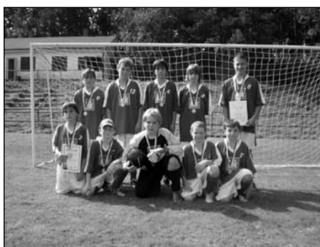
Minifotbal, žáci 6.-7. tříd okresní kolo – 1. místo