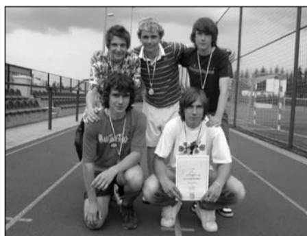
Atletický čtyřboj, žáci 8.-9. tříd okresní kolo – 1. místo krajské kolo – 3. místo