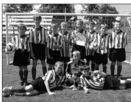
McDonald's Cup, žáci 4.-5. tříd okresní kolo – 3. místo