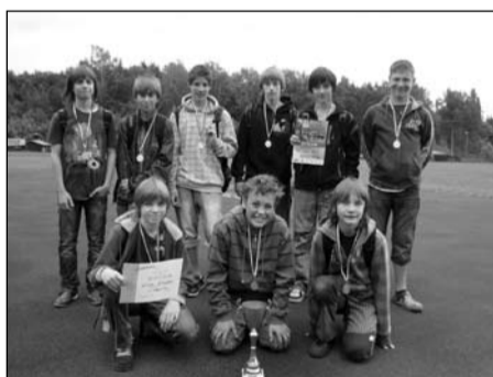
Pohár rozhlasu, žáci 6.-7. tříd okresní kolo – 1. místo krajské kolo – 2. místo