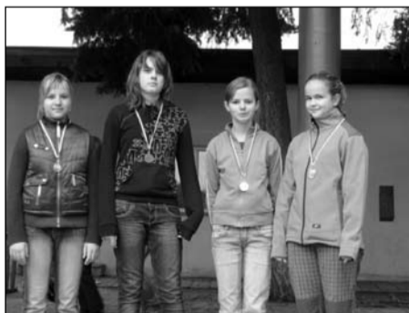
Přespolní běh, žákyně 6.–7. tříd okresní kolo – 3. místo