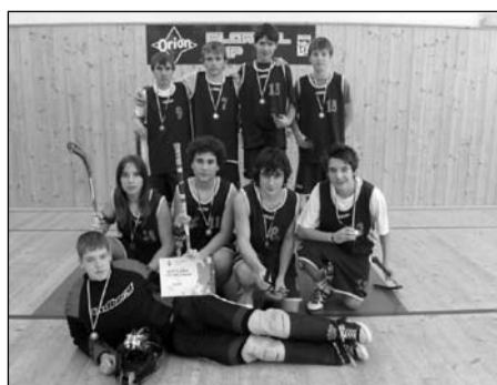
Basketbal, žákyně 5.-7. tříd okresní kolo – 1. místo krajské kolo – 4. místo