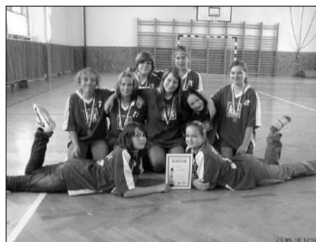
Přehazovaná, žákyně 6.–7. tříd okresní kolo – 3. místo