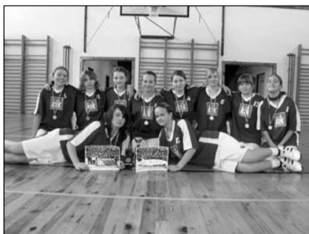
Basketbal, žákyně 5.-7. tříd okresní kolo – 1. místo krajské kolo – 4. místo