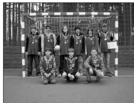
Házená, žáci 6.–7. tříd okresní kolo – 1. místo