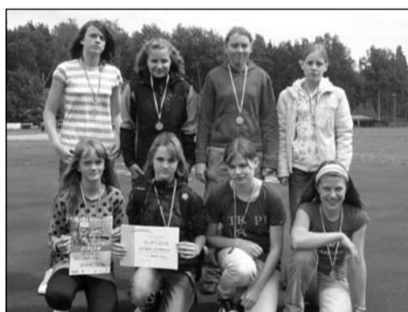
Pohár rozhlasu, žákyně 6.-7. tříd okresní kolo – 1. místo krajské kolo – 8. místo