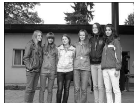
Přespolní běh, žákyně 8.–9. tříd okresní kolo – 2. místo