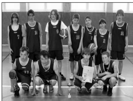
Basketbal, žáci 5.-7. tříd okresní kolo – 1. místo krajské kolo – 3. místo