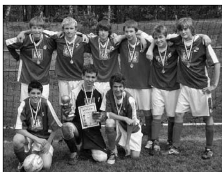
Minifotbal, žáci 8.-9. tříd okresní kolo – 1. místo