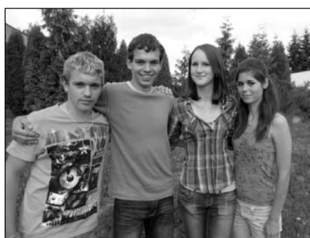
Dopravní soutěž, žáci a žákyně 8.-9. tříd okresní kolo – 1. místo