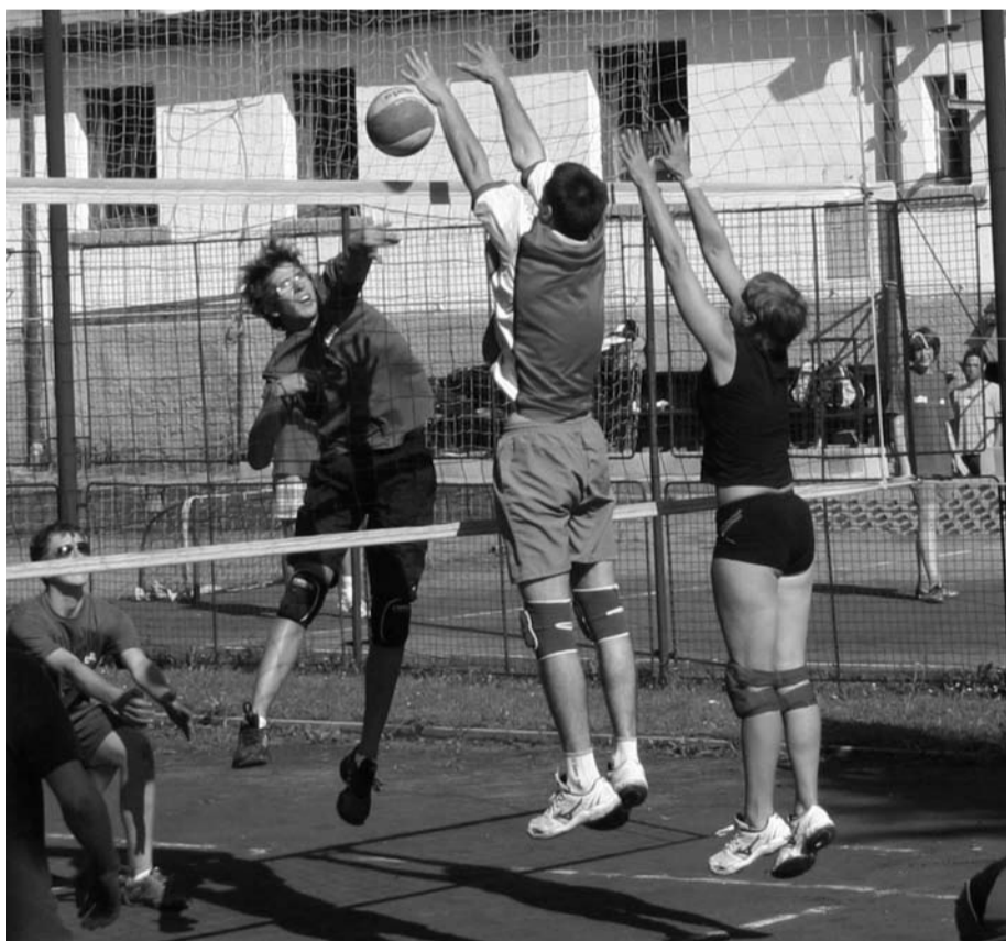
Na volejbalovém turnaji smíšených družstev skončil kralovický B tým (na bloku C. Catuna a J. Mandausová) celkově druhý.