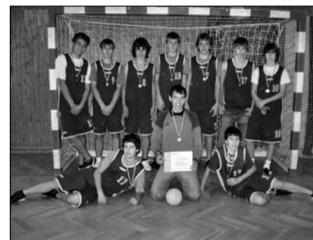
Házená, žáci 8.–9. tříd okresní kolo – 3. místo