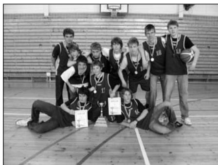
Basketbal, žáci 8.-9. tříd okresní kolo – 1. místo