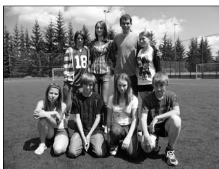
Orientační běh, žáci a žákyně 6.-9. tříd krajské kolo – 1. místo celostátní kolo – 7. místo