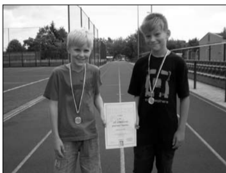
Atletický trojboj, žáci 2.-3. tříd okresní kolo – 1. místo