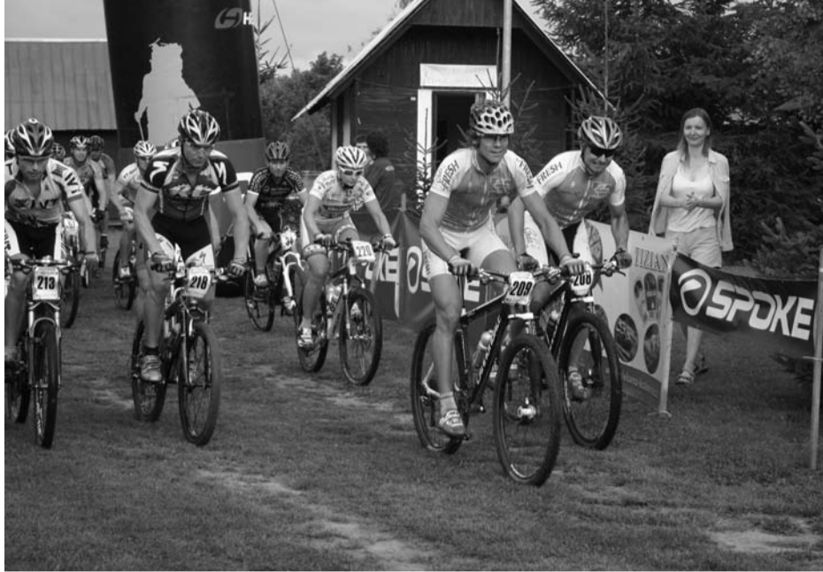
Téměř tři stovky bikerů se v sobotu 27. srpna zúčastnily osmého ročníku MTB maratonu. Na snímku start nejdělsí 92 km dlouhé trasy.

nická Urbanová, pětadvacítku vyhrál Pavel Hauer (Čížice), mezi ženami pak Patrícia Procházková z Úlic.