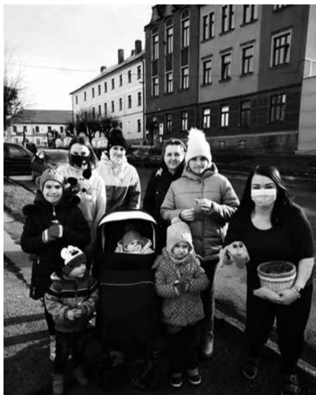
Na fotografii je zachycena jedna z prvních výprav spolu s pracovníky domu dětí, které drží maňásky jménem Hugo a Kivín. A jsou to právě Hugo s Kivínem, kdo děti po stezkách provázejí a zadávají jim základní úkoly.

děni jsou k nalezení vždy na webu domu dětí www.ddmkralovice.cz nebo na profilu na facebookových stránkách. (pz)