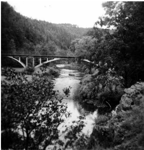
Silniční most pod Borkem přes Střelu v roce 1942.