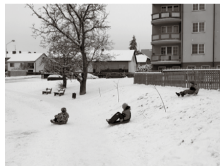
Děti (a nejen ony) se v několika únorových zimních dnech mohly věnovat zimním radovánkám.

Nejprve mezi 7. a 17. lednem, kdy napadla trocha sněhu, a hlavně zamrzly rybníky. Následně se zejména denní teploty šplhaly nad nulu (max. bylo 10,9 °C v pondělí 22. ledna) a sníh i led zmizel. A pak se zima ohlásila v únoru (7.–15. 2.). Nejprve přišlo velké množství srážek: v sobotu šestého začalo vydatně pršet, během dne s klesající teplotou přešel déšť ve sněžení a o den