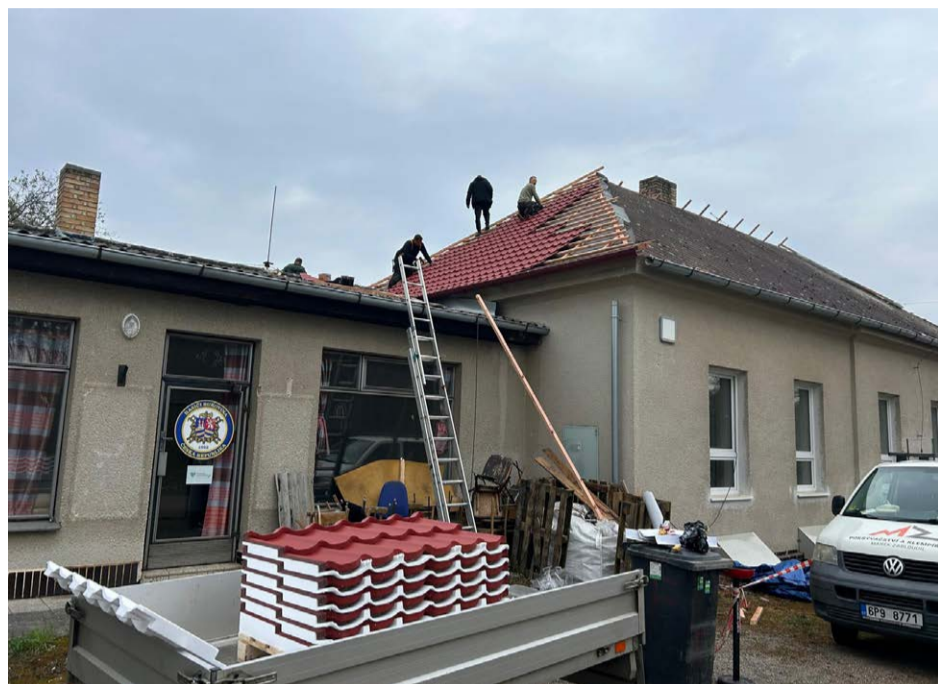
V dubnu začaly opravné práce na střeše kulturního domu v Bukovině.