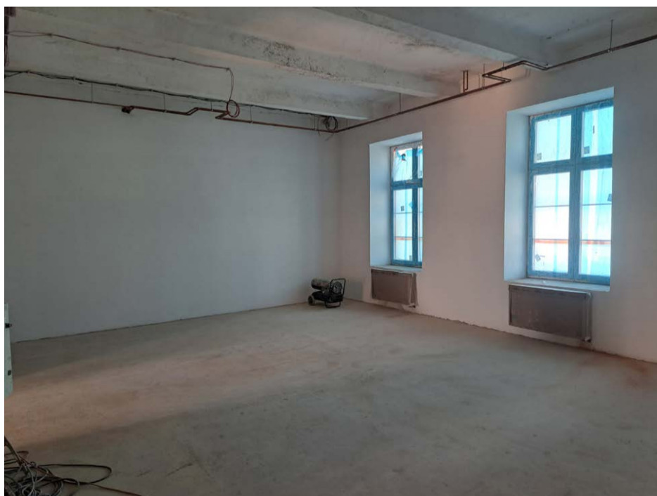
V areálu bývalých kasáren se pracuje na přístavbě objektu č. 2 (dříve mj. kuchyňský blok) na dům dětí a mládeže.