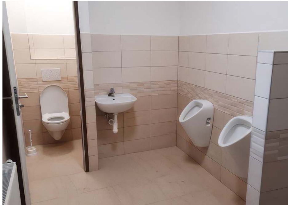
Zrekonstruované sociální zařízení v kulturním domě v Bukovině.

Poté proběhne úklidová brigáda, která uvede objekt po stavebních činnostech do užitelného stavu. Michael Krupička