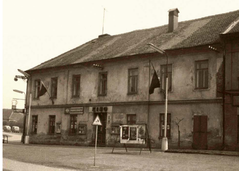
Hostinec U Boháčků s kinem v roce 1963. Fotoarchiv muzea v Mariánské Týnici

Budova čp. 89, v níž bylo kino umístěno, byla na počátku 90. let vrácena původním majitelům. Jelikož nájem na jeho užívání byl značně vysoký