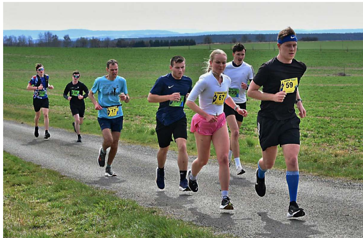
Čtvrtý ročník přespolního běhu Velká kralovická se uskutečnil v neděli 5. dubna.

STOLNÍ TENIS – SO 9. 5.: turnaj mužů (9.00 hod., sokolovna).