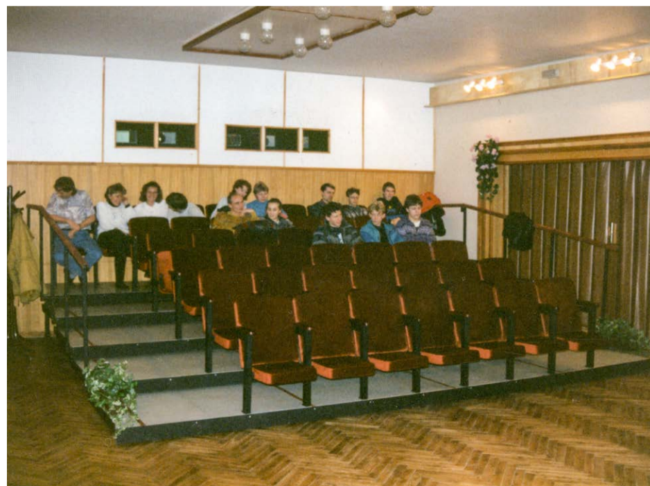
Otevření kina v Lidovém domě v roce 1996.