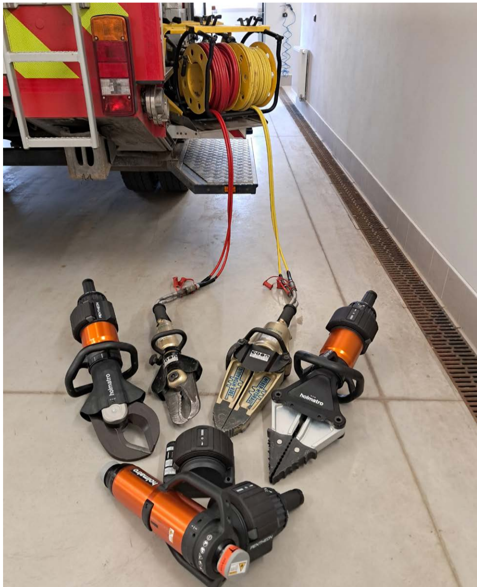
Nové vyprošťovací zařízení nahradilo po 20 letech provozu staré zařízení.

s akumulátorovým pohonem od renomovaného výrobce Holmatro. Dodavatelem, který vzešel z výběrového řízení, se stala