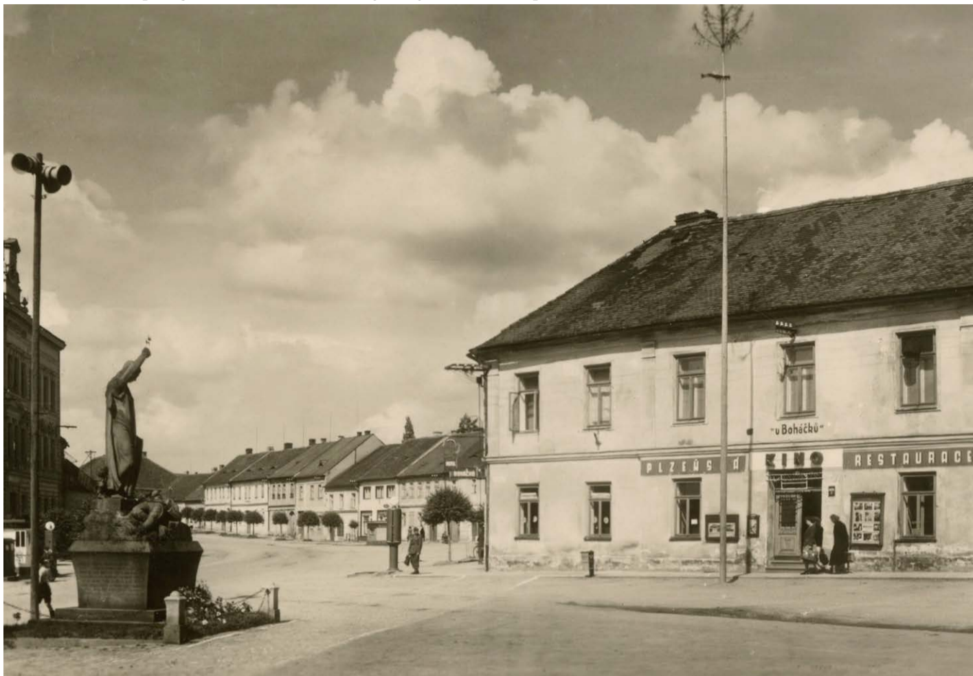
Hostinec U Boháčků s kinem v 50. letech 20. století.

kina zařadili do programu také Dětský filmový festival a Přehlídku sovětských filmů. Na přelomu 70. a 80. let byla v kralovickém kině vystavěna nová promítací plocha upravená na širokoúhlé promítání a hlediště bylo vybaveno novými sedadly s postupným převýšením, byly upraveny podlahy, rozvodna, elektroinstalace, osvětlení, vytvořena nová šatna, pokladna a kavárna s 50 místy. Nově rekonstruované kino dostalo v roce 1980 název Mír.