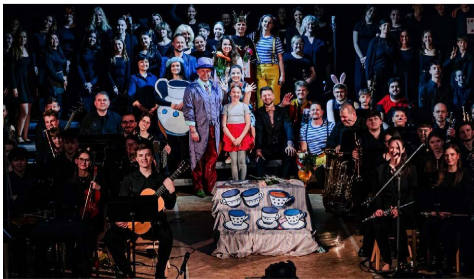
Premiéra autorského muzikálu Alenka v říši divů proběhla 20. března v Kulturním domě Klub v Horní Bříze.

Všechny spoluobčany zveme na pietní akt, který se bude konat u příležitosti připomenutí si konce II. světové války u památníku buchenwaldských vězňů na kralovickém hřbitově ve čtvrtek 7. května. Začátek je v 18.30 hodin.