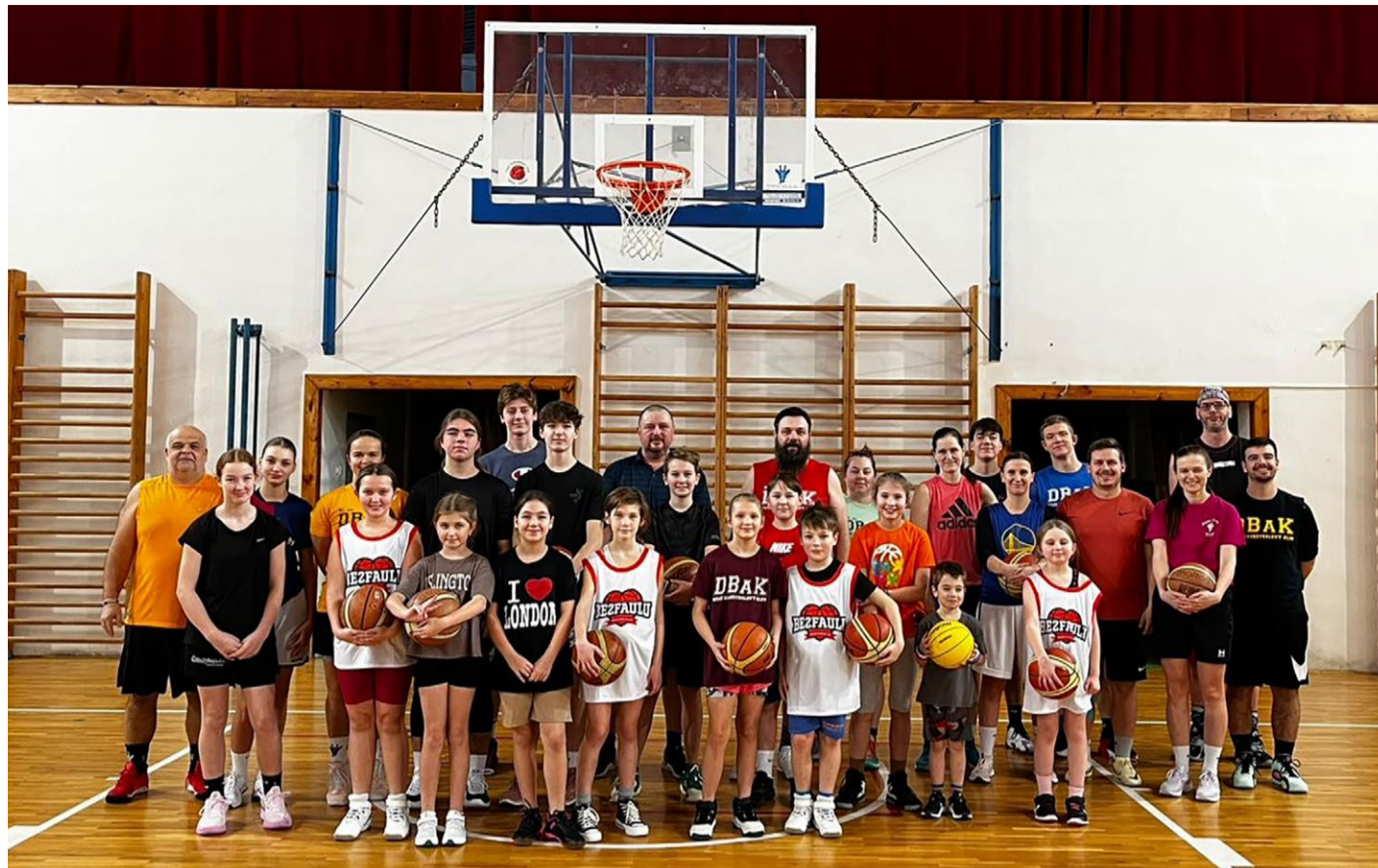
Kazdoroční basketbalový duel Sudá v Lichá se hrál 5. ledna. Exhíbční zápas organizovaný DBK Kozlany-Kralovice skončil v kozlanské tělocvičně výsledkem 125:125.

22; kolektivy (19): 1. nohejbal (muži, SK Hradecko A) 66 b., 2. turist. závod (štafeta mužů) 53, 3. fotbal (dorostenci) 42, 4. basketbal (ženy) 37, 5. stolní tenis (muži A) 28; hlavní ktg. (28): 1. M. Štefl