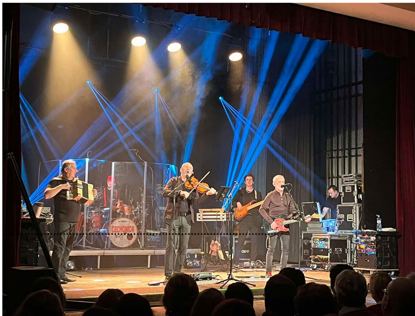
Koncert skupiny Čechomor, který se konal 6. ledna, byl parádní a nezapomenutelný zážitek, o čemž svědčil i vyprodaný sál. Díky patří členům kapely, která na hudební scéně vystupuje již pětadvacet let.

Jaro v lidovém domě bude opravdu pestré! (měks)