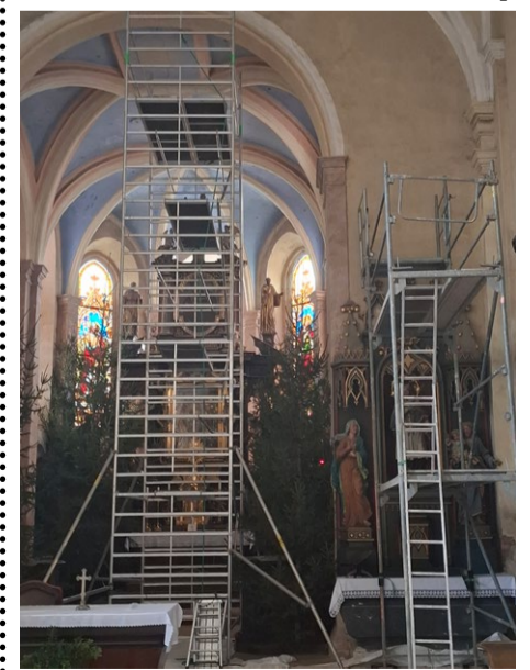
Postavené lešení v hlavní lodi kostela.