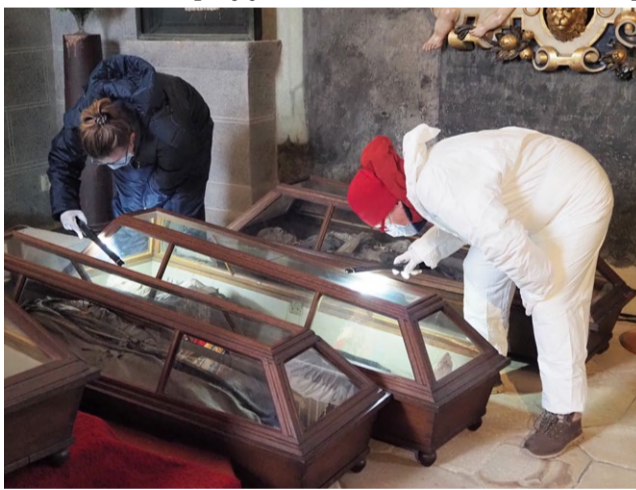
Restorátorky při zjišťování stavu mumii.

kteřá udržuje v hrobce optimální podmínky pro jejich uchování.“ Tomáš Soukup