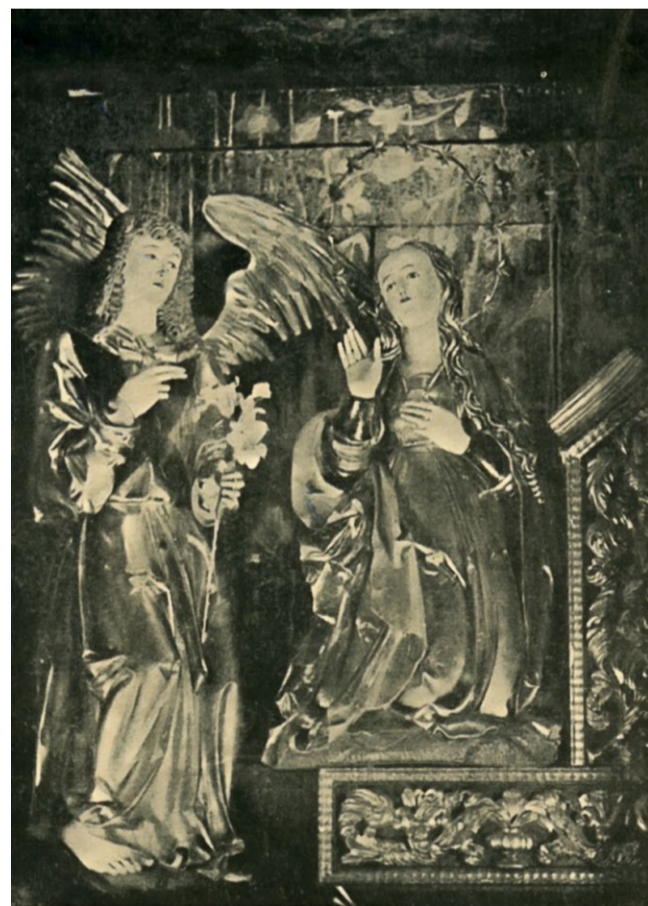
Tiskoviny s vyobrazením sousoší Anděla Zvěstování a Panny Marie Týnecké. Sběrka Muzea a galerie severního Plzeňska v Mariánské Týnici