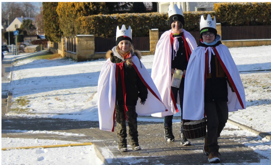
Několik koledníků obcházel za doprovodu dobrovolníků z řad Klubu důchodců město Kralovice v rámci charitativní Tříkrálové sbírky v pátek 10. ledna. Na snímku jedna ze skupin.