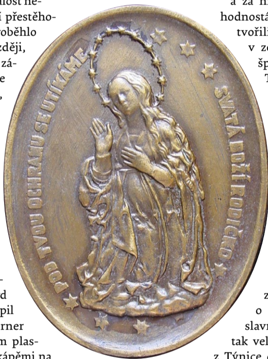
Medaile s Pannou Marií Týneckou. Sběrka Muzea a galerie severního Plzeňska v Mariánské Týnici