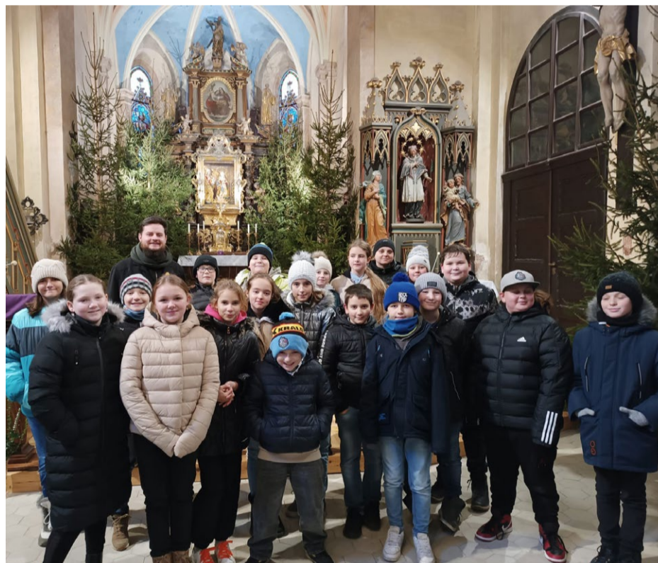
Žáci pátého ročníku v interiéru kostela s farářem ŘKF Kralovice (na snímku zcela vzadu vlevo).