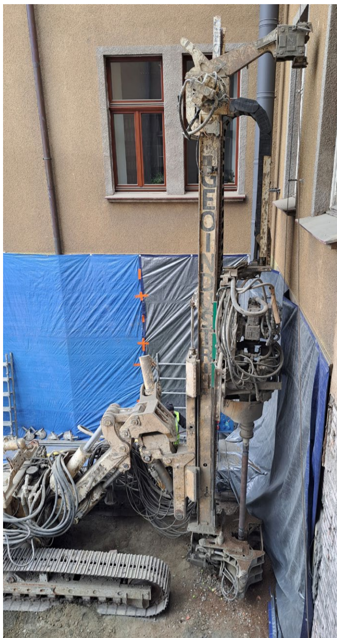
V budově radnice a jejím okolí (zejména dvůr) probíhají stavební práce na vybudování výtahu. Vchod do knihovny je z tohoto důvodu provizorně zabezpečen ze dvora městského úřadu (z Havlíčkovy ulice). Na konci ledna odborná firma prováděla speciálním strojem vrty nutné pro usazení nosných pilotů.

je proto vchod do knihovny také pouze ze dvora radnice. Uzavřena je až do konce srpna ze stejného důvodu i obřadní síň (dočasně