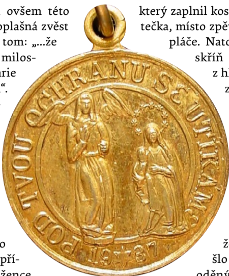
Průvlek se sousoším Anděla Zvěstování a Panny Marie Týnecké, 1937. Sběrka Muzea a galerie severního Plzeňska v Mariánské Týnici