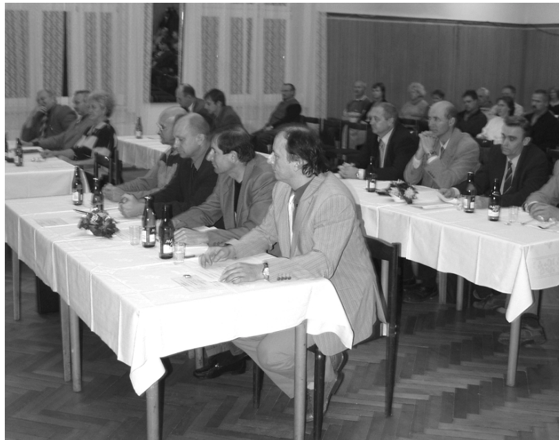
Lidový dům v Kralovicích, středa 1. listopadu 2006. Nově zvolené zastupitelstvo města se sešlo na svém prvním zasedání.