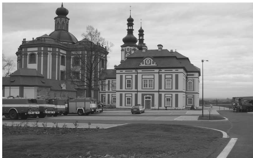
31. října se naši hasiči zúčastnili cvičení, zaměřeného na likvidaci případného požáru v objektu okresního muzea v Mariánské Týnici.