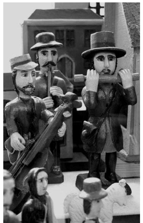
Vyřezávané postavičky lidového betlému ze sbírek muzea v Mariánské Týnici.

Pracovníci muzea vás na tyto akce co nejrůzněji zvou a všem svým návštěvníkům přejí hezké vánoční svátky a do roku 2008 zdraví a pohodu. J. D.