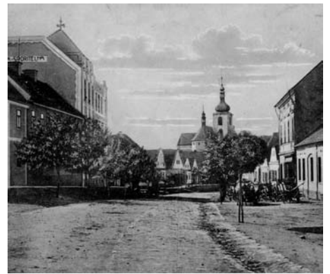
Shora: Dům p. Langa na konci 30. let 19. století, pohled do Markovy ulice před a po výstavbě budovy městské spořitelny. Karel ROM