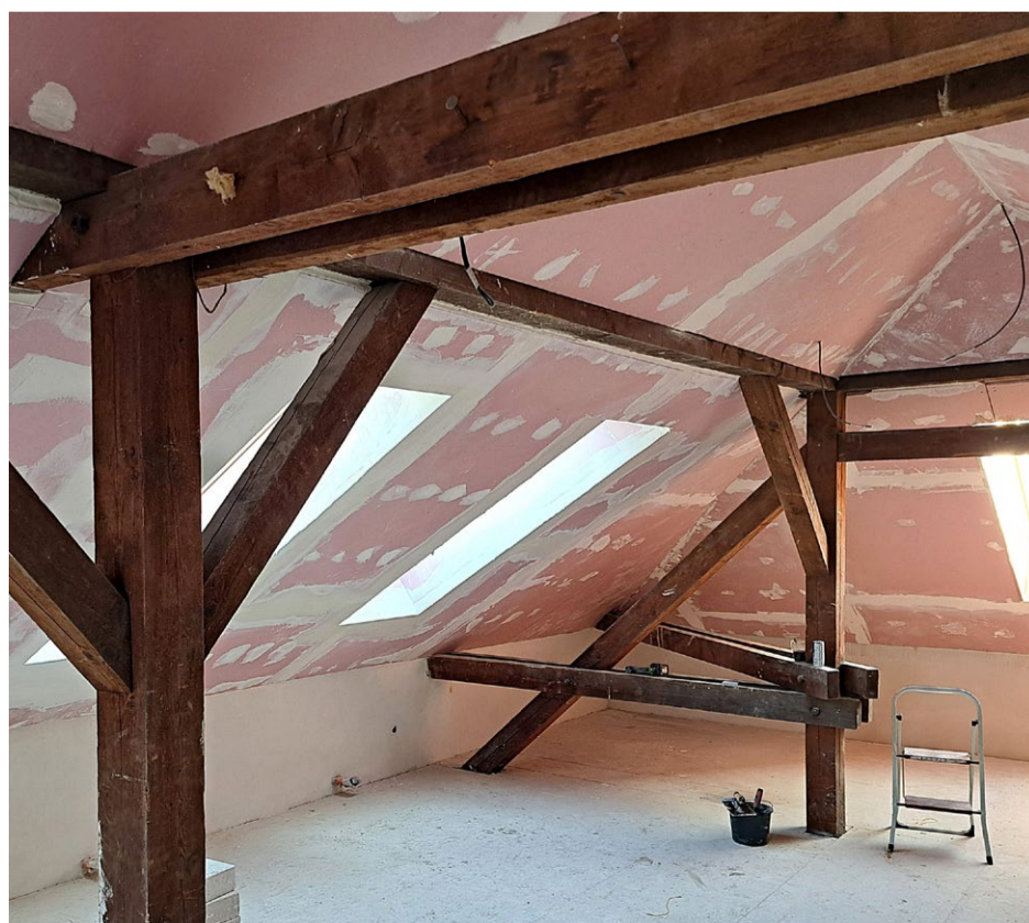
V areálu bývalých kasáren se pracuje na přestavbě objektu č. 2 (dřívě mj. kuchyňský blok) na dům dětí a mládeže. Na části objektu je již hotova fasáda, stavební firma provádí rovněž úpravy interiéru.