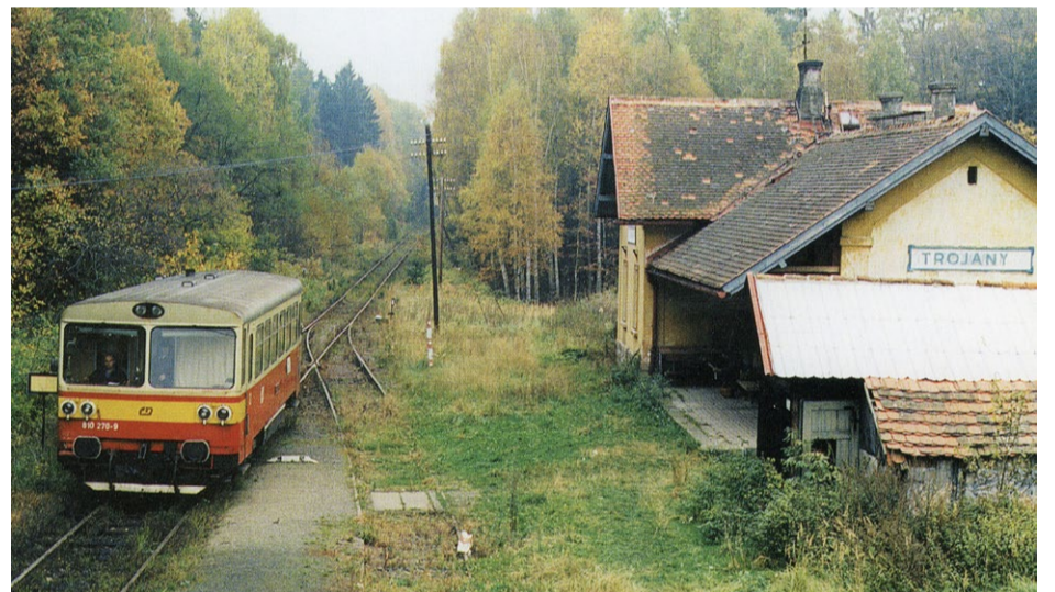
Motorový vůz řady 810 na trojanském nádraží. Sbirka muzea v Mariánské Týnici

na kamenné podezdívce krytá taškami. Za ní byla vyhloubena staniční studna, obdobně jako jinde kamenná s dřevěným poklopem a železným čerpadlem. Pak již navazovala výpravná budova, která byla zděná z kamene a cihel a krytá taškami. Podle půdorysného plánu byla v budově čekárna a kancelář, do nichž se vcházelo z peronu, a ve zbylé části byl byt pro podúředníka o čtyřech prostorách, do něhož se vcházelo od silnice. Jiné vchody budova neměla. Obcí Bukovina, k níž tehdy Trojan administrativně náležely, a na jejichž katastrálním území se nádraží nachází, bylo vydáno povolení k užívání budovy 7. června 1899 a bylo jí přiděleno čp. 22.