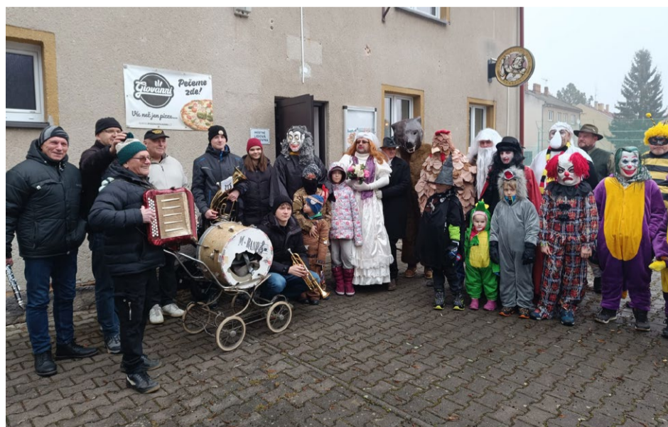
Každoroční masopust se konal v Hradecku v sobotu 7. února – na snímku jsou zachyceny masky, než se vydaly na tradiční průvod obcí.