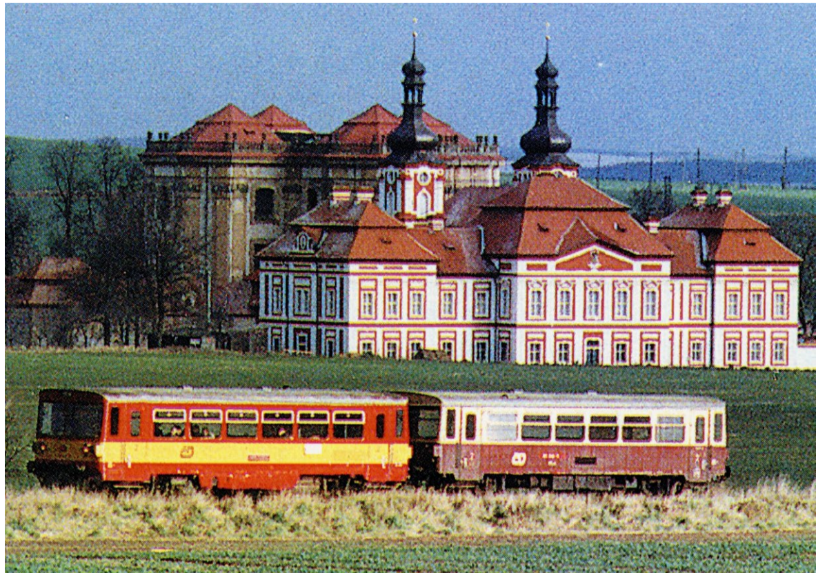
Motorová souprava na železniční trati u Mariánské Týnice v roce 1996. Sbirka muzea v Mariánské Týnici

Místo ní bylo vybudováno nádraží Trojan, které se nachází na 31.6 – 31.8 km a jediné na trati bylo již od roku 1899 zřízeno jako zastávka, resp. zastávka a nákladíště. Všechny nádražní objekty byly postaveny na levé straně kolejí, které mělo dvě koleje. Na okraji nádraží stála kůlna na uhlí a hasičské nářadí, tedy dřevěná stavba