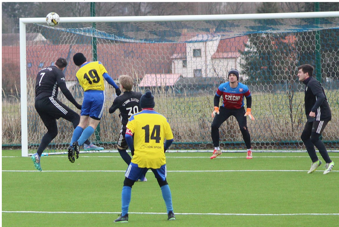
Kralovičtí fotbalisté (ve světlém) se v rámci zimního soustředění utkali v Žihli s celkem Žlutic.

TURISTIKA – SO 21. 3.: KRALOVICKÝ ŠUSTREK , I. ročník pochodu okolím Kralovic. Trasy 6.1, 10.3 a 17.6 km, start v budově DDM Pohodáček od 7.30 do 10.00 hodin, cíl tamtéž do 17.00 hodin.