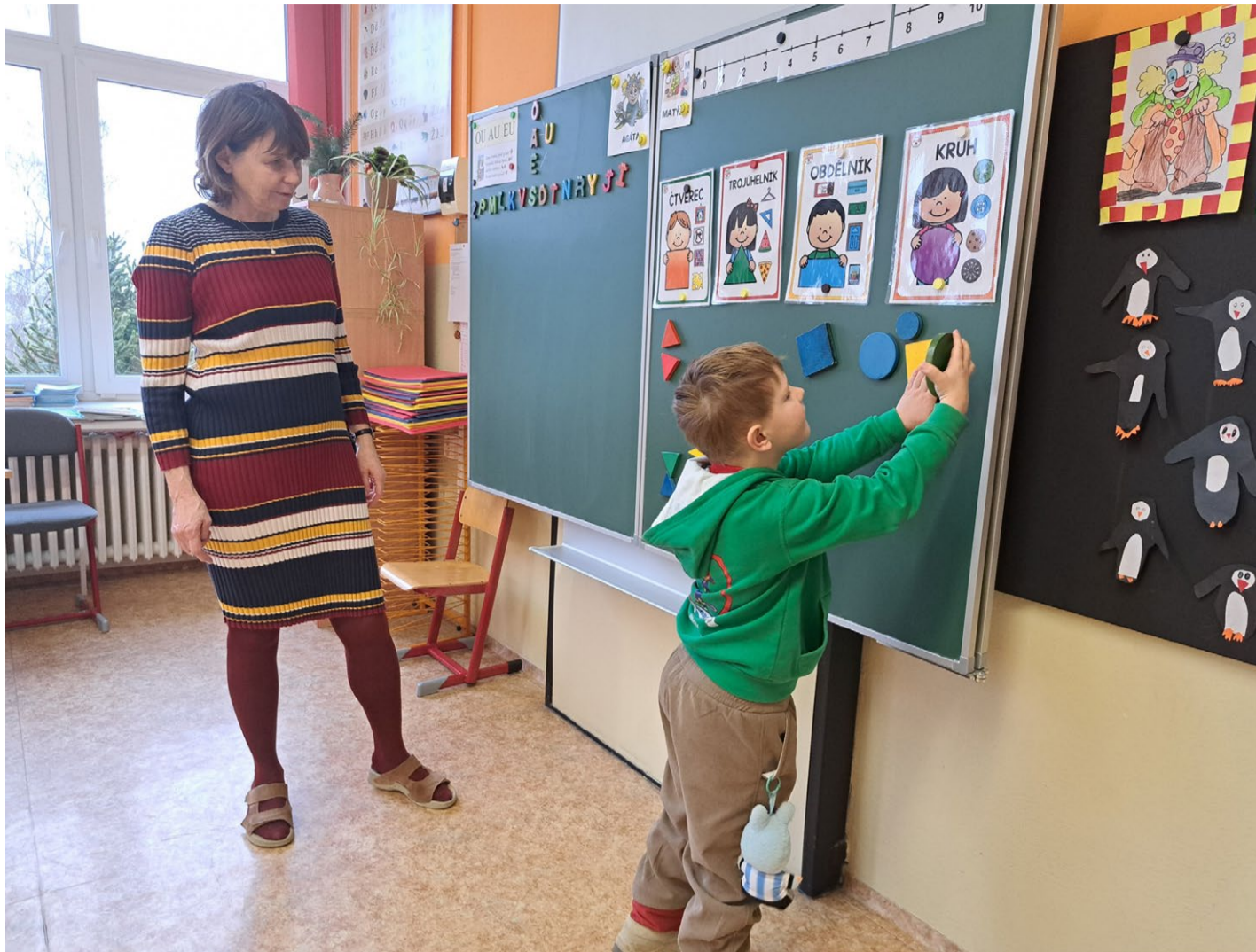
Pravidelný zápis žáků do prvních tříd pro školní rok 2025/2026 se konal v Základní škole Marie Uchytlové Kralovice ve středu 11. února.