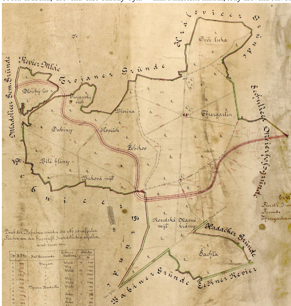
Původně plánovaná trasa železniční trati kolem Olšanské obory, v jejím centru je Olšanská myslivna, k níž se paprskovitě sbíhají lesní cesty. Sbirka muzea v Mariánské Týnici