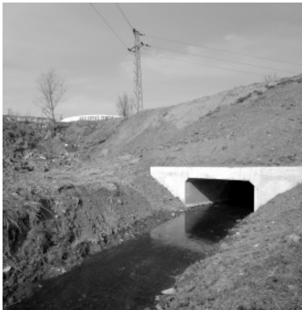
Rekonstrukce čistírny odpadních vod se chýlí ke konci a technologické zařízení se připravuje k uvedení do zkušebního provozu, který potrvá do konce letošního roku. Upraveno bylo i přemostění Kralovického potoka s přístupovou cestou k čistírně (na snímku), které již hrozilo sesutím. Jeho rekonstrukce si vyžádala náklady ve výši asi 700 000 korun.