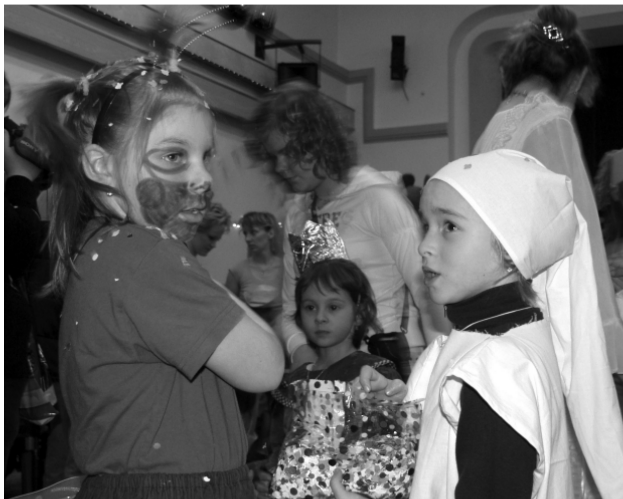
Dětský maškarní bál se konal v sobotu 24. března odpoledne v Lidovém domě v Kralovicích. Součástí programu bylo vyhodnocení masek, různé soutěže a nechyběla ani tombola. Poděkování za přípravu patří domu dětí a mládeže, tělovýchovné jednotě Sokol a městskému kulturnímu středisku.

Ověřovatelé zápisu: RNDr. Jiří Tišer, Karel Karban