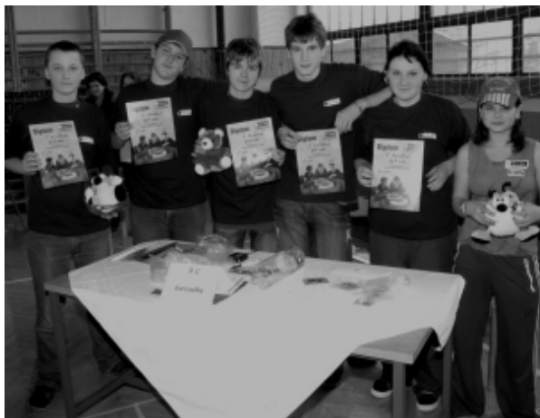
Vítězové školního kola soutěže Paragraf 11/55.

Z tříhodinového klání prokládaného vystoupením děvčat z kroužku aerobiku a tanečního kroužku, zástupců taekwon-da a pěveckého sboru vyšlo vítězně červené