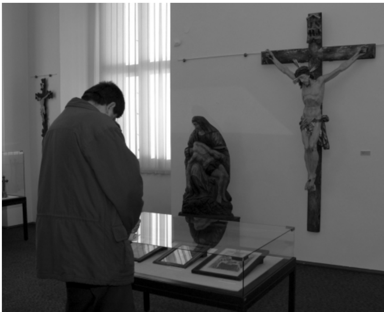
Novou sezonu zahájilo Muzeum a galerie severního Plzeňska v Mariánské Týnici v úterý 27. března vernisáží výstavy "Od masopustu do Velikonoc". Návštěvníci si mohou prohlédnout několik desítek exponátů, dokumentujících duchovní obsah největšího křesťanského svátku i jeho odraz v lidové tradici. Výstava potrvá do 6. května.

OD MASOPUSTU DO VELIKONOC (28. 3. – 6. 5.), PLASTIKOVÉ MODELKY (9. 5. – 17. 6.), SVĚT PANENEK (20. 6. – 5. 8.), JUBILANTI HOLLARU 2007 (7. 8. – 16. 9.), BOHUSLAV VALENTA – výběr z díla (18. 9. – 28. 10.).