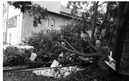
Velký vítr 9. srpna způsobil značné škody: smrk na Masarykově náměstí padl na dům čp. 255 (vedle Klubu důchodců, foto vpravo), našťastí střechu nijak nepoškodil. Bude nutné porazit ovšem i druhý sousední strom, který by se mohl při větrných porывech vyvrátit z kořenů. Větve stromů lámal víchřivý i v letním kině (vlevo).

Všechny občany města i přidružených obcí zveme na dvacáté zasedání zastupitelstva města, které se bude konat ve středu 19. září 2018 od 18.00 hodin v Lidovém domě.