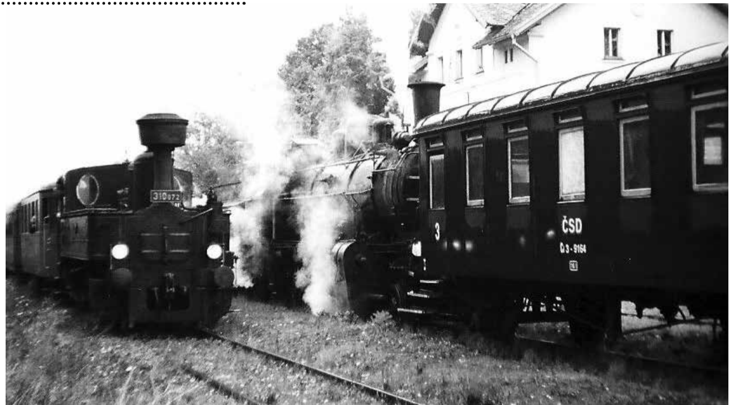
Ilustrační foto: archiv V. Koptý