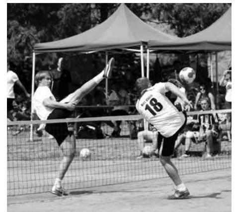
Nohejbalového turnaje v Hradecku se v sobotu 11. srpna zúčastnilo 12 trojic. Vítězem klání se stal celek Hradiště. Na snímku bojují ve vzájemném duelu domácí výběry.