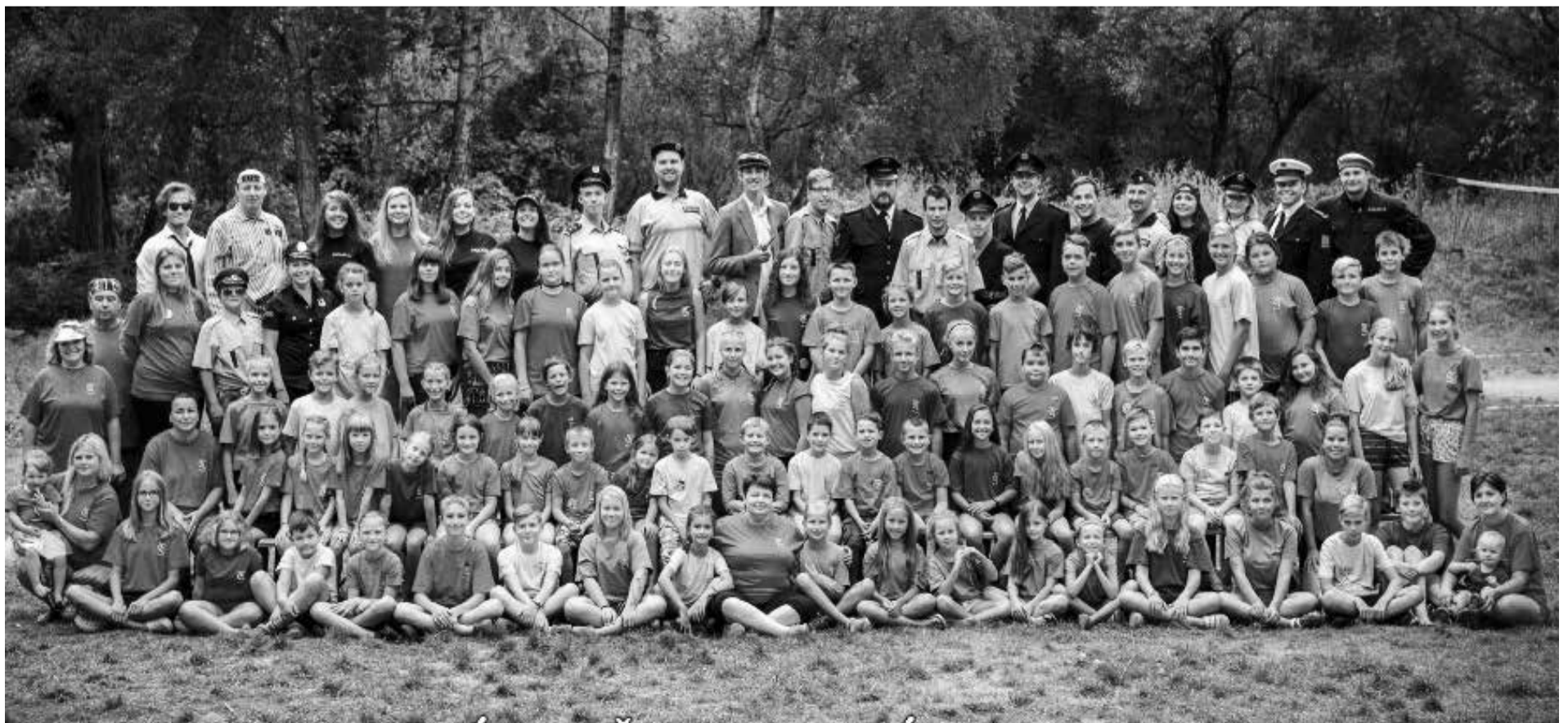
Místo činu – Oblátek 2018. Společná fotografie účastníků letního tábora DDM Kralovice, který proběhl od 11. do 22. srpna. Další tradiční akce – oblíbené příměstské tábory se konaly v Kralovicích na začátku srpna a v Kozlancech poslední prázdninový týden. Zápisy do kroužků DDM Kralovice budou probíhat od pondělí 10. září.