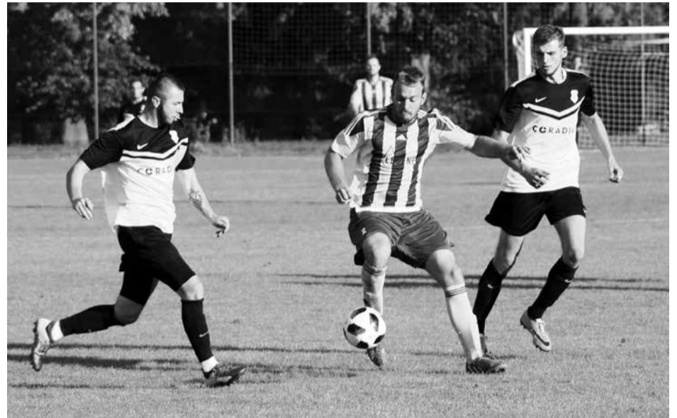
Fotbalisté vstoupili do nové sezony v I. A třídě domácí výhrou nad Žihlými 4:1 (viz snímek, Kralovice v pruhovaném).

BASKETBAL: tradiční předsezonní turnaje pořádané DBK Kozlany/Kralovice proběhnou v kozlanské tělocvičně v těchto termínech: 7. až 9. Mini Kra-Kož Cup pro kategorii dívek U15, 14. ž. 16. září Mikro Kra-Kož Cup (ktg. U13) a 21. až 23. září „klasický“ Kra-Kož Cup pro kadetky a juniorky U17+U19.