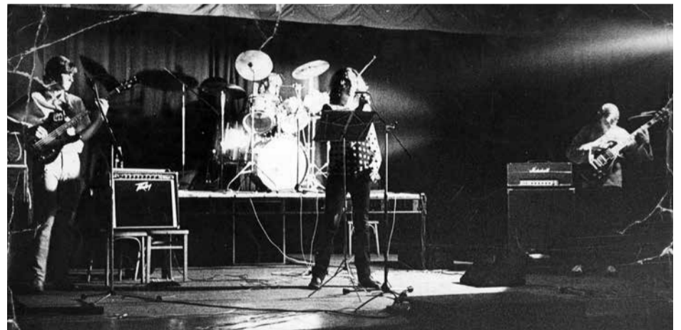
Tři bigbeatové kapely na archivních snímcích – shora The Oxfords, Vlamijomi a Domino.