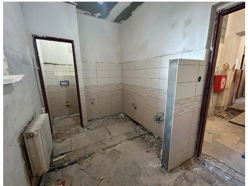
V hospodě v Bukovině probíhá oprava sociálního zařízení.

nákladů v roce 2026 a uzavření příslušné veřejnoprávní smlouvy.