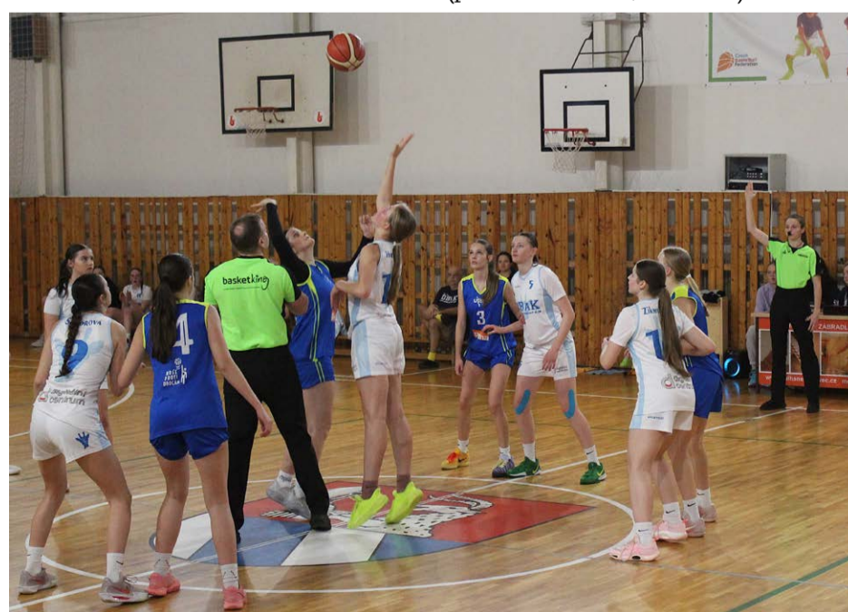
Basketbalistky DBaK (v bílém) zdolaly v utkání extraligy žákyň kategorie U15 v kožlanské tělocvičně celek USK Praha 71:54.

FOTBAL: muži přátelsky v. Podbořany 4:3, v. Žlutice 3:3; 6. liga (I. A tř.) v. Švihov 1:4, v. Klatovy 1898 1:6, v. Zruč 2:2; 8. liga (OP) muži B v. Trnová 3:3