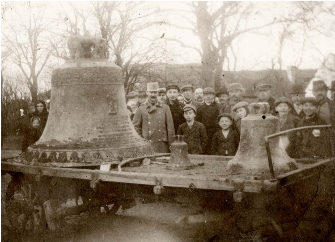
Rekvírované zvony z kostela sv. Petra a Pavla 5. ledna 1917. Kronika Římskokatolické farnosti Kralovice