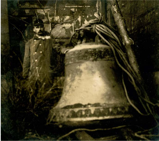
Zvon Petr – rekvizice 5. ledna 1917.