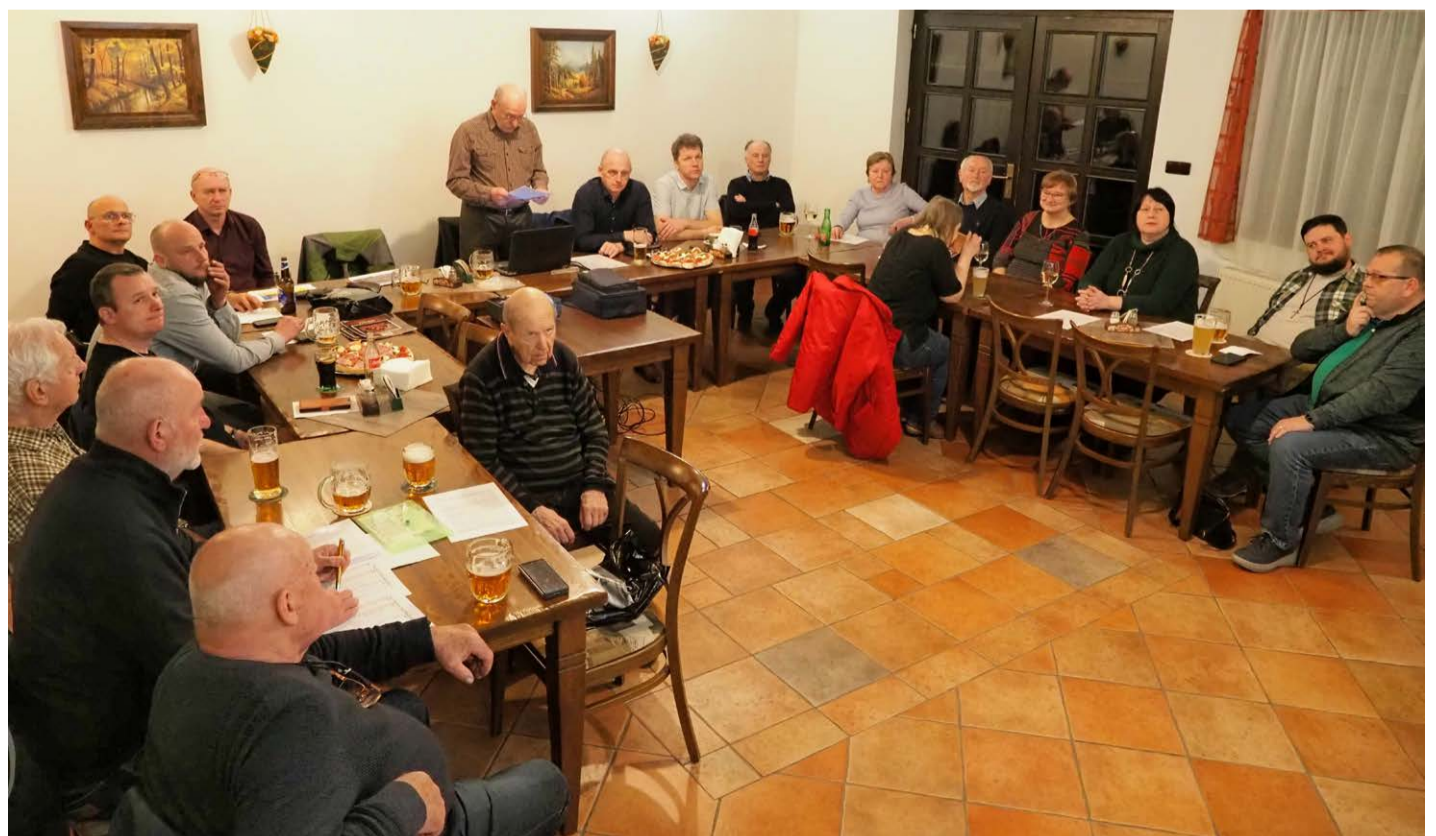
Gryspek: V pátek 13. března se sešlo 17 členů na valné hromadě Spolku Gryspek, aby zhodnotilo práci za uplynulý rok a stanovilo si cíle na rok 2026.

a zodpovědný přístup každého z nás. Pomozme chránit zdraví lidí, kteří se o náš odpad starají a vykonávají tuto náročnou a často nedocenenou práci. (jč, pz)