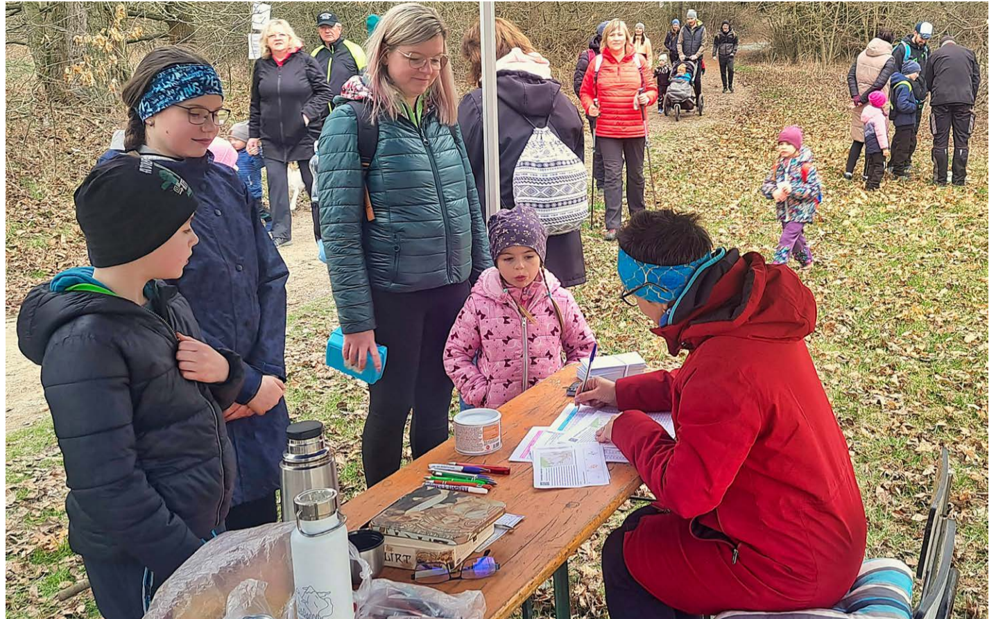
První ročník turistického pochodu Šustrek okolím Kralovic se uskutečnil v sobotu 21. března. Pořadatelé z domácího TOM Šikulové a dalších organizací zaregistrovali na trasách 6,1, 10,3 a 17,6 km celkem 207 účastníků.