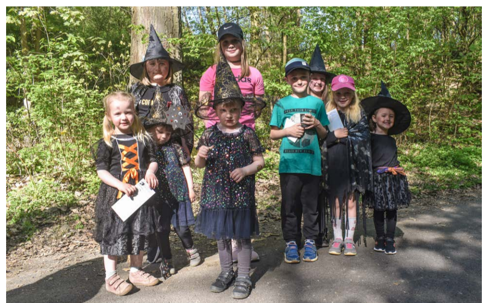
Na loňskou čarodějnou stezku se na startu zaregistrovalo celkem 150 dětí v doprovodu 114 dospělých. Atmosféru celé akce navíc podtrhly nápadité kostýmy – většina malých účastníků dorazila převlečená za čarodějnice a čaroděje.