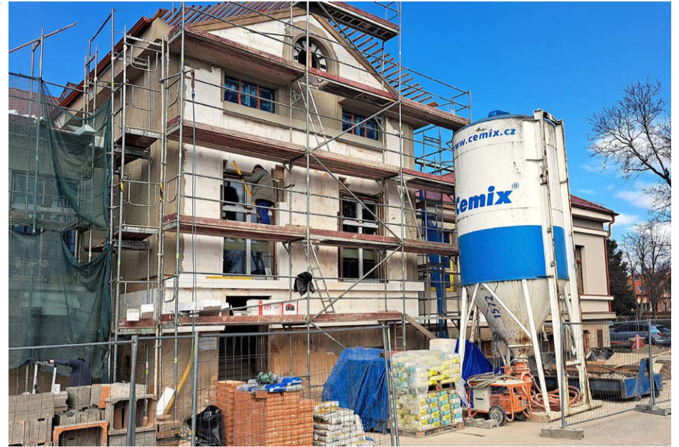
Probíhající rekonstrukce budovy č. 2 bývalých kasáren na dům dětí a mládeže.