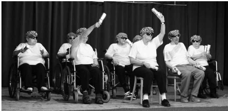
Osmý ročník přehlídky aktivizačních činností domů sociální péče Kralovický podzim s tématem „Muzikálové hity“ se konal ve velkém sále Lidového domu ve středu 12. září. Na snímku je vystoupení klientů DSS Kralovice.

• Protokol o výsledku průběžné kontroly v Základní škole Kralovice provedené Krajským úřadem Plzeňského kraje dne 21. 5. 2018 • Usnesení ze třetího zasedání Školní rady Základní školy Kralovice, které se uskutečnilo dne 30. srpna 2018.