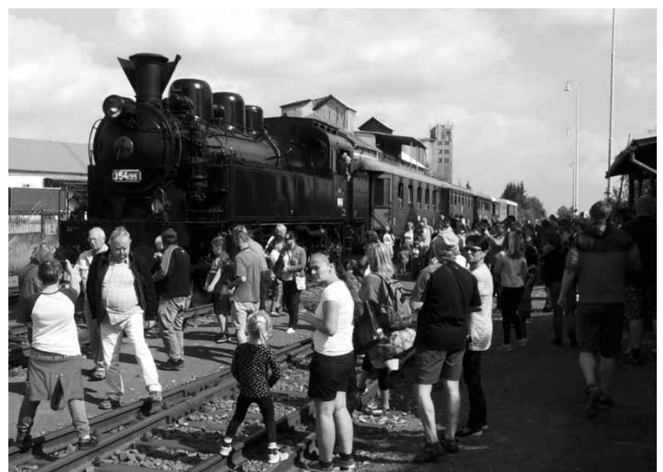
Historický parní vlak přijel z Lužné u Rakovníka na kralovické nádraží v sobotu 15. září. Shlednout soupravu nebo se vlakem projet do Čisté a zpět přišla celá řada zájemců.