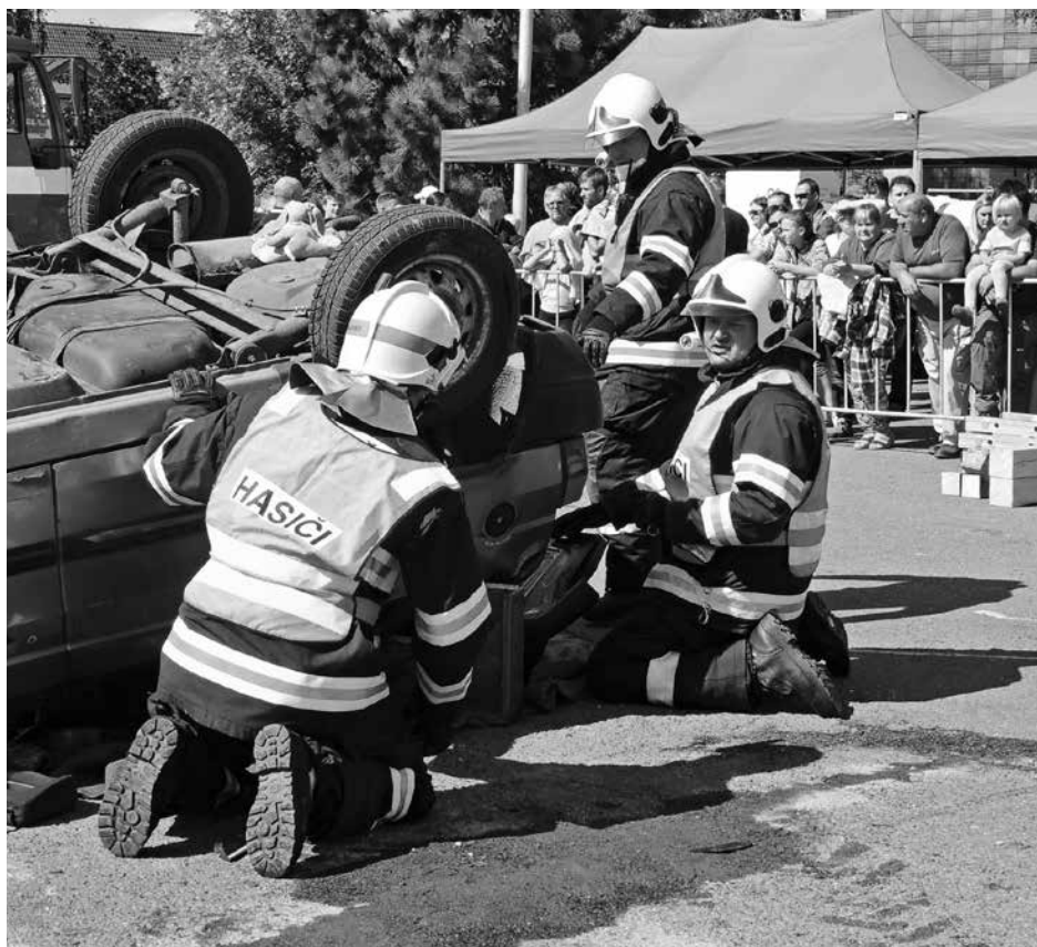
Druhý zářijový víkend se na náměstí Osvobození konala soutěž hasičských družstev O cenu starosty města ve vyprošťování u dopravních nehod. V klání devíti týmů obstála nejlépe jednotka z Ostrova, druhý skončil Zbiroh, třetí Zvíkovec a čtvrtou příčku obsadil pořadatelský sbor (viz snímky).