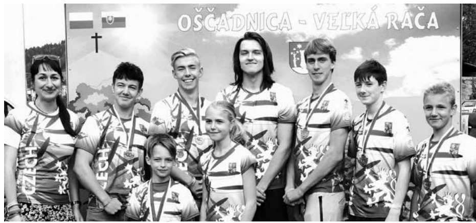
Z mezinárodního mistrovství v turistických závodech, jež se konalo čtvrtý zářijový víkend ve slovenské Oščadnici, si přivezla devítičlenná kralovická výprava šest medailí (2-2-2). Je to nejlepší výsledek Kralovic ve čtyřadvacetileté historii šampionátů.