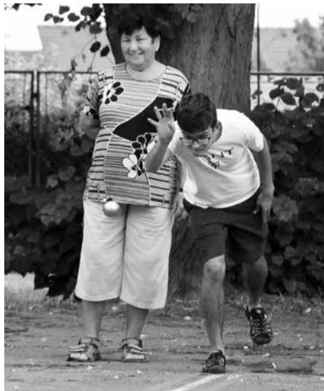
Třetího kola dlouhodobé soutěže v petanque se zúčastnilo jedenáct dvojic.

Každý den se na start postavilo 900 závodníků. V lesích mezi Hlubokou a Rabštejnem n. S. se všem velmi líbilo. Pochvalovali