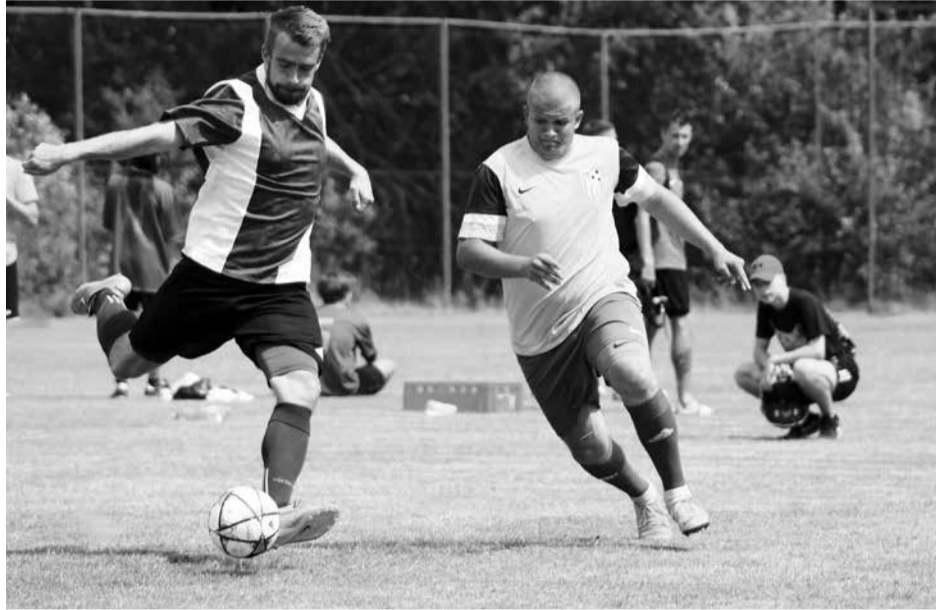
Fotbalový Procházekův memoriál vyhrál celek FC Oblátek (tmavé dresy).

Kralovice – Druhý červnový víkend uspořádal oddíl Kometa Kralovice závody národního žebříčku B, Čechy-západ v orientačním běhu (OB). Centrem akce byla louka u obce Hluboká na severním Plzeňsku, kde bylo veškeré zázemí pro závodníky a jejich doprovod. V tomto prostoru se v roce 1991 běžel závod na klasické trati mistrovství světa v orientačním běhu. Od té doby nebyl tento krásný terén pro orientační běh využitý, až nyní.