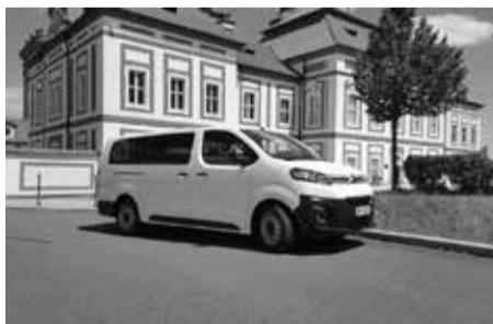
Pro potřeby Domu dětí a mládeže Kralovice zakoupilo město Kralovice vozidlo Citroën Jumpy 1.5 BlueHDi 120 S&S Man kombi 1.3 (na snímku).

ORIENTAČNÍ BĚH: národní žebříček A i B (1. a 2. 6., Doksy) – klasická trať, ktg. D10 10. A. Hanáková, ktg. D12 5. M. Gelnerová, 8. D. Bodurková, ktg. D14B: 17. A. Gelnerová; ktg. D16B 3. E. Fišarová; ktg. D20B 4. D. Biersa-