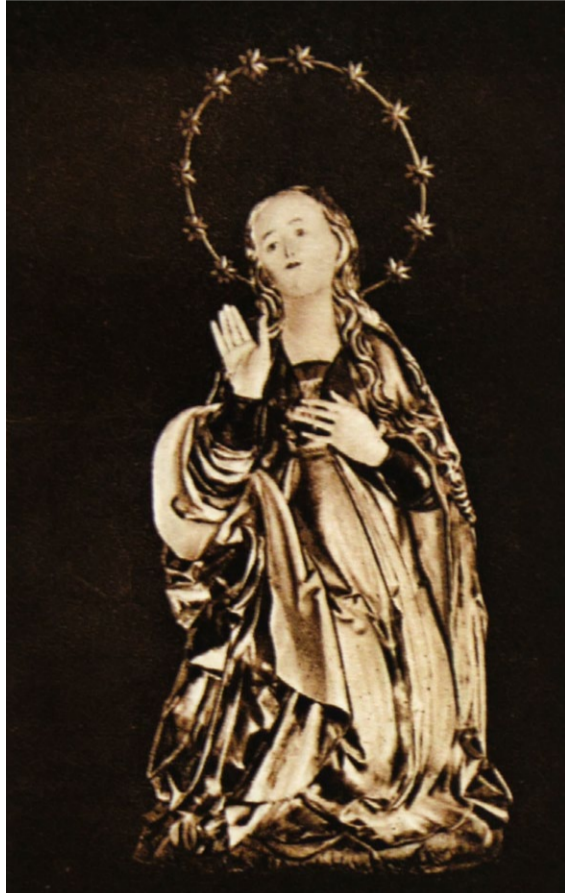
Panna Marie Tejnická, tisk ze 30. let 20. století.