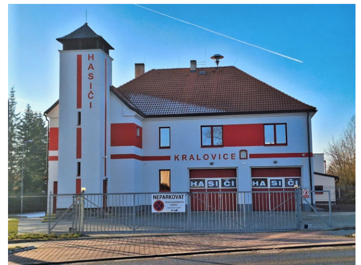
Stavební práce na rekonstrukci a přístavbě hasičské zbrojnice byly ukončeny na přelomu listopadu a prosince. Rozsáhlé úpravy stály více než 16 mil. korun a byly podpořeny dotačními tituly z Ministerstva vnitra a Plzeňského kraje.