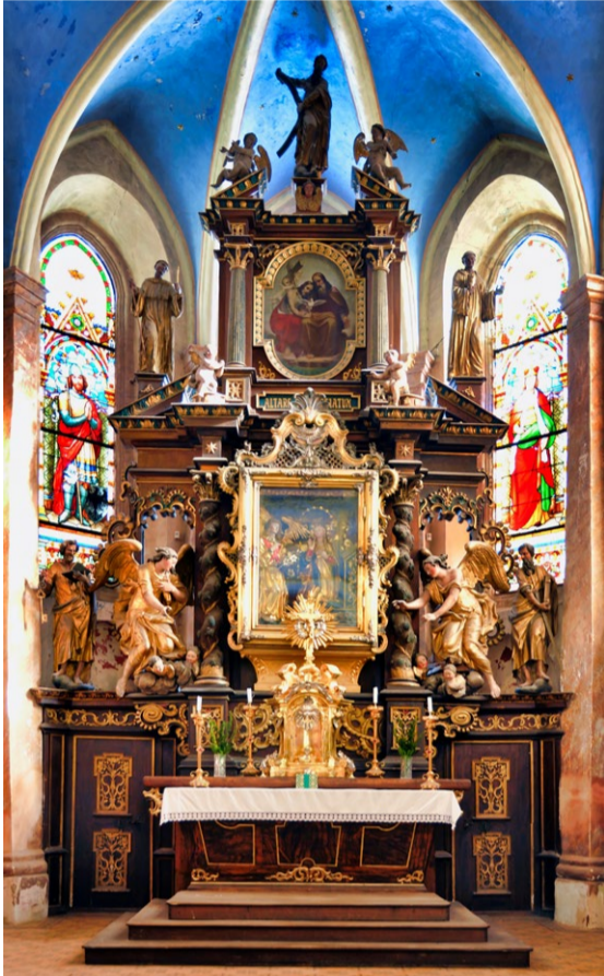
Hlavní oltář kralovického kostela se sousoším Anděla a Panny Marie Tejnické v roce 2017.