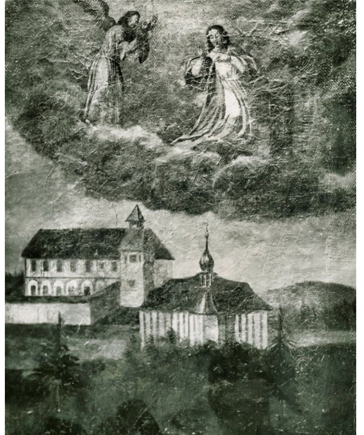
Starý kostel v Mariánské Týnici.

Sousoší Anděla a Panny Marie bylo vytvořeno pro kostel Zvěstování Panně Marii v Mariánské Týnici na objednávku cisterciáků sídlících v Plasích, k jejichž klášteru týnecký poutní kostel patřil. Autor sochy není znám jménem, ale je označován, právě podle díla, jako Mistr Týneckého Zvěstování. Pracoval, popř. jeho dílna pracovala, na přelomu 15. a 16. století v západních Čechách a pravděpodobně sídlil v Plzni. K jeho dalším pracím patří například sochy sv. Jana Evangelisty a sv. Bartoloměje z Cerhovic, socha Jana Křtitele v Čivčích nebo Madona z Chomle u Rokycan.