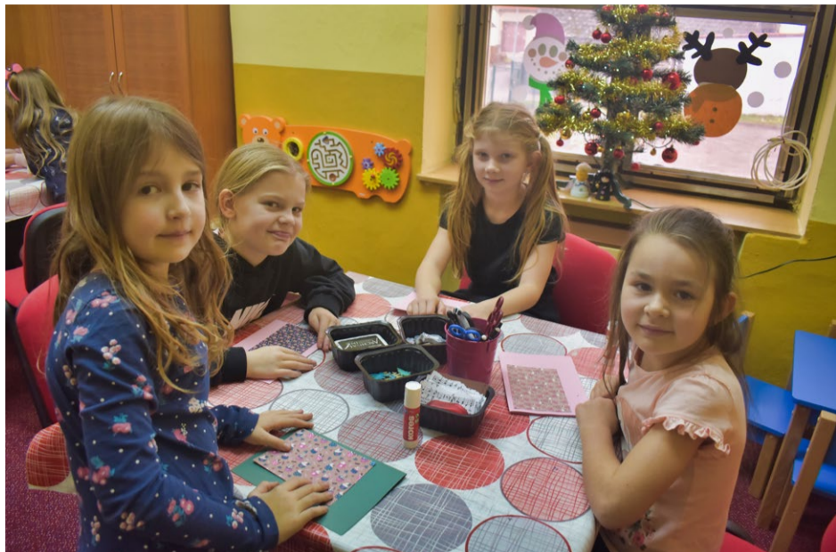
V předvánočním čase navštívilo Pohodáček během tří dnů na sto dětí, které si přišly v odpoledních hodinách vyrobit krásné vánoční dekorace.