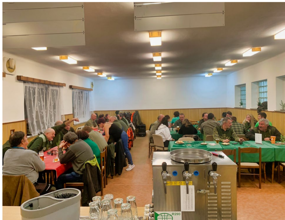
Záběr na hosty z výčepu.