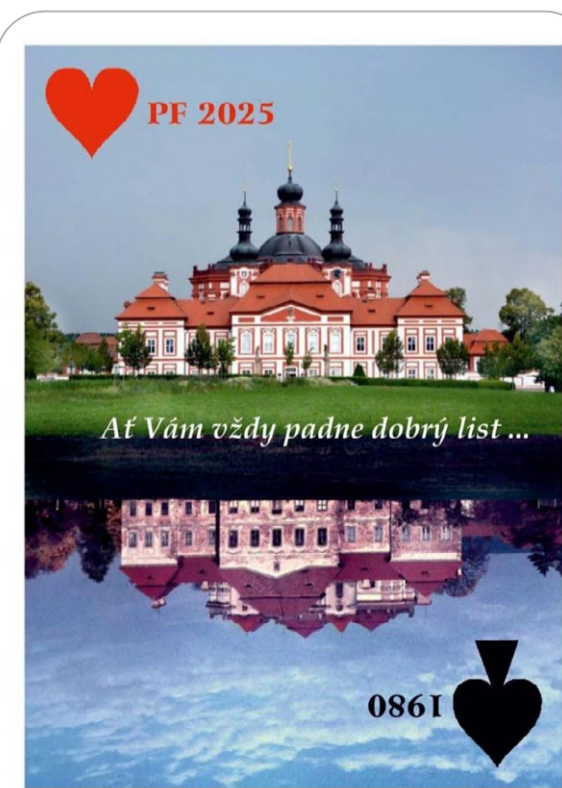
Milí čtenáři, kolektiv pracovníků Muzea a galerie severního Plzeňska v Mariánské Týnici Vám přeje do roku 2025 hlavně pevně zdraví, radostnou mysl a mnoho pracovních a osobních úspěchů.