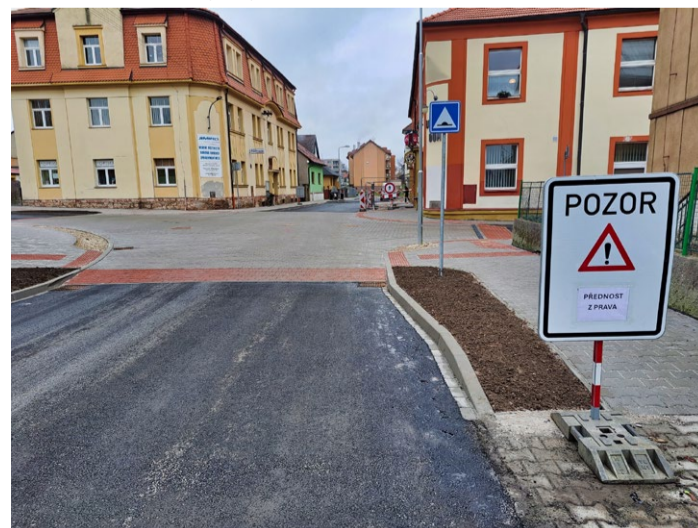
Nově upravená křižovatka u lidového domu (a část Školní ulice) byla zprůjezdněna v prosinci, finální pokládka asfaltového povrchu proběhne pravděpodobně v březnu. Křižovatka má zvýšený práh a došlo zde ke změně přednosti v jízdě.