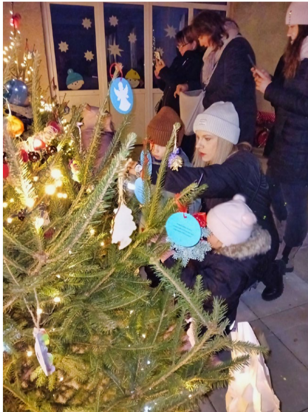
Šeptání dětských přání u stromu zůstalo velkým tajemstvím a zároveň nadějí, že se splní.