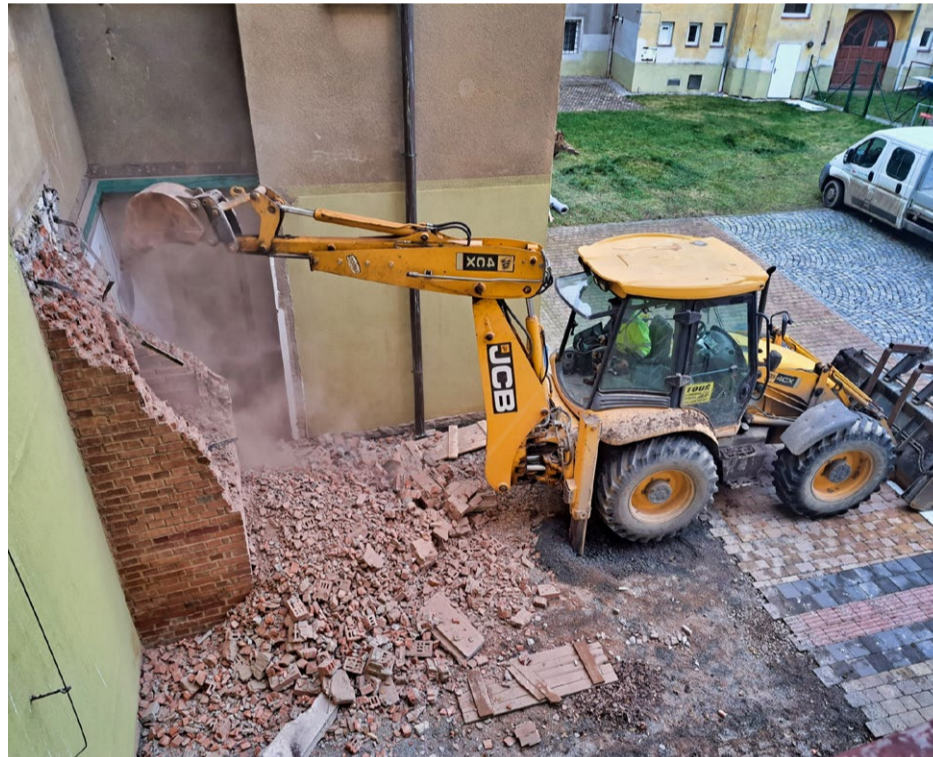
V prosince započala přístavba výtahu k budově radnice.

Již na konci loňského roku začala příprava výstavby výtahu na budově radnice. Výťah bude přístupný ze dvora (z Havlíčkovy ul.) a realizace akce, která by měla být hotova do konce srpna, přináší např. nutnost provizorního vstupu do městské knihovny. Ten je po dobu konání akce přístupný rovněž ze dvora radnice z Havlíčkovy ulice (více na straně 3). Uzavřena bude ze stejného důvodu také obřadní síň a dočasně se oficiálním místem pro uzavírání sňatků stane velká zasedací místnost městského úřadu v Manětínské ulici. Přístavba vyjde na více než pět milionů korun a je podpořena 50 % dotací (uznatelné náklady) z Ministerstva pro místní rozvoj ČR.