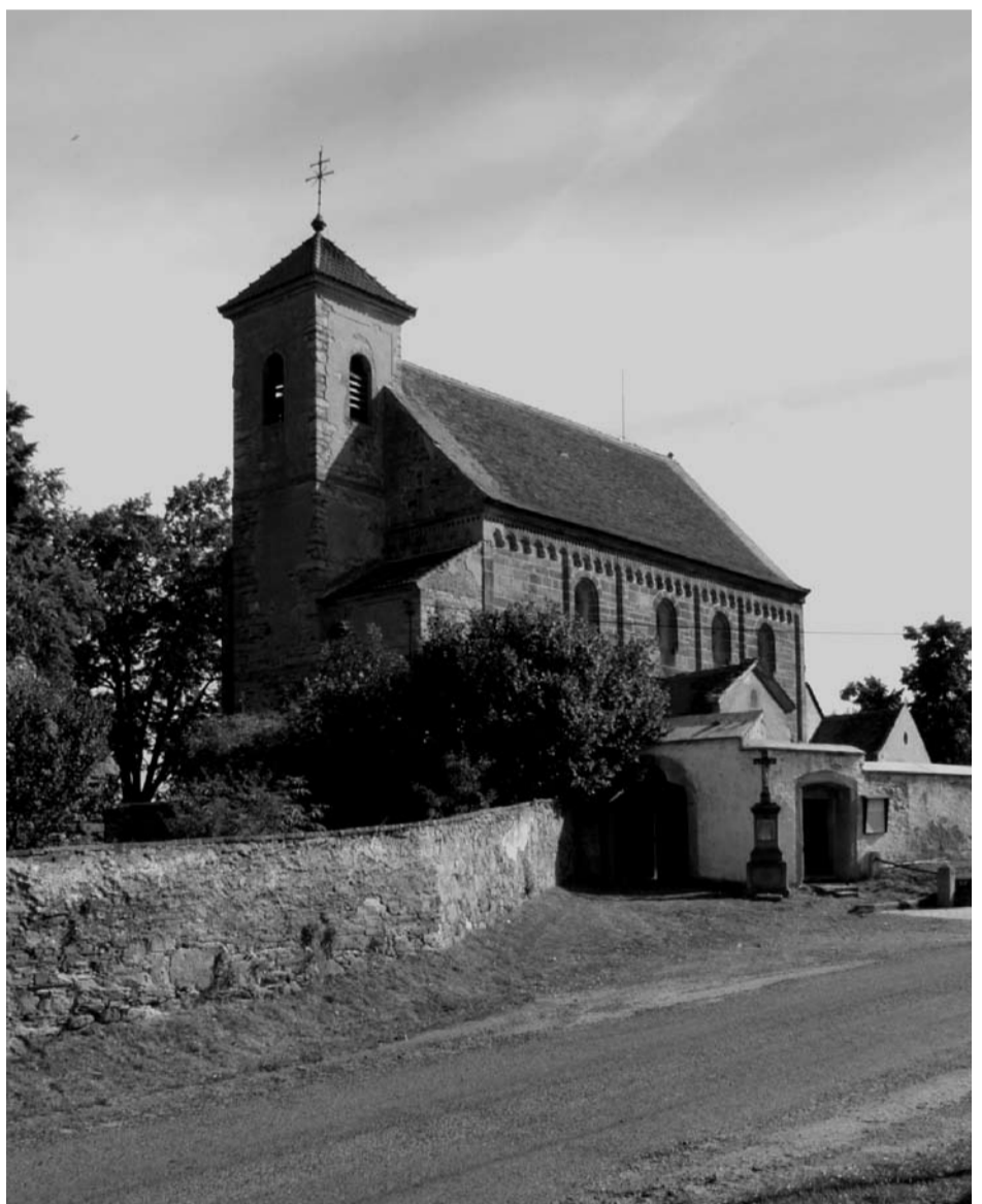
Kostel sv. Mikuláše v Potvorově.

Druhá část Potvorova zůstala dlouho při hradu Krašovu, v roce 1546 se dostala do majetku Floriána Gryspěka na Kaceřově. Poté, co byl r. 1622 gryspěkovský majetek konfiskován, byla tato část Potvorova, původně náležející klášteru zderazskému, věnována klášteru v Plasích. Tomu pak patřila až do jeho zrušení, kdy majetek přešel pod správu náboženského fondu. Od roku 1826 pak náleželo panství Metternichům,