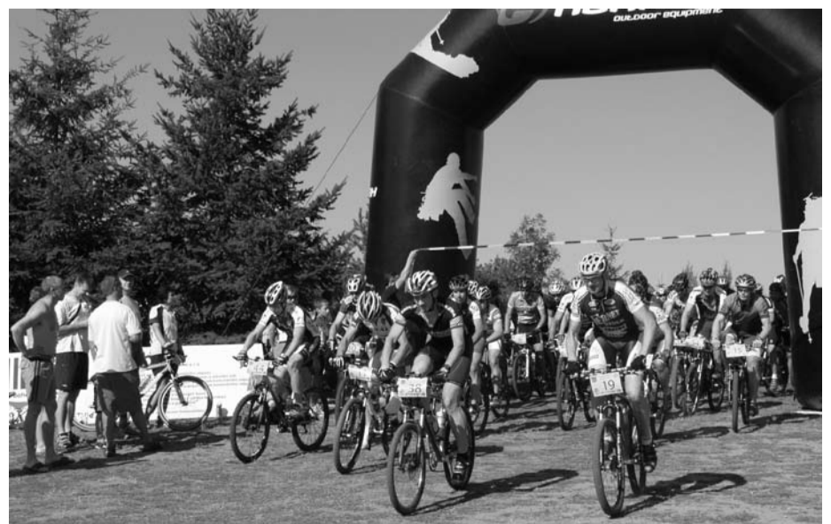
Díky obětavosti členů Bike clubu vstoupilo naše město do povědomí vynavačů jízdy na horských kolech. Potvrdil to i sobotní kralovický bike maraton. Blíže ve sportovní rubrice.

Ještě jednou připomínáme, že počínaje dnešním dnem je úřední deska města Kralovice přemístěna z prodejny HK Novum do nově instalovaných vývěsek na oplocení u radnice směrem ke kostelu v Markově ulici. Důvodem je rozšíření kapacity – deska totiž neslouží jen potřebám města samotného, ale je zde třeba uveřejňovat i dokumenty týkající se celého správního obvodu Kralovic jako obce s rozšířenou působností III. stupně. Vitrina u p. Karbana zůstane zachována pro vyvěšování smutečních oznámení i jiných informací, přestává však být úřední deskou města.