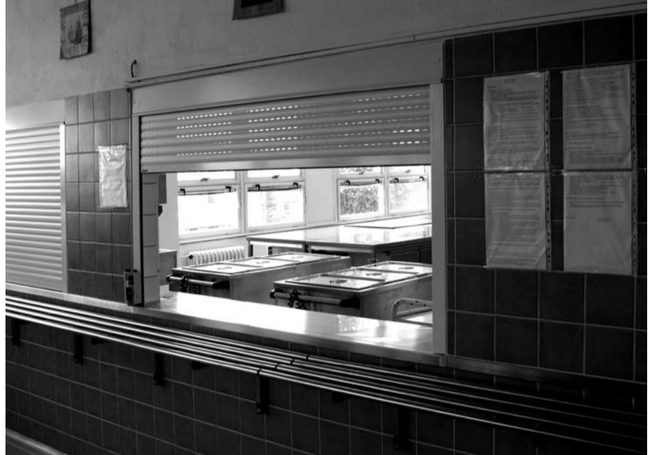
Modernizací prošla i jídelna základní školy.

kou míru pomoci a podpory jsou zřizovány speciální třídy. Ty budou v kralovické základní škole praktické dvě a jejich zvláštností je, že učitelé pomáhá ve třídě ještě asistent – nemusí to být vysokoškolsky vzdělaný pedagog, nezbytnou podmínkou je však absolvování speciální přípravy pro tuto práci. S tím souvisí i výrazně odlišný poměr počtu žáků a učitelů v těchto školách – v kralovické se o děti stará 11 pedagogických pracovníků a 3 provozní zaměstnanci. Změny ve výuce v souvislosti s novým vzdělávacím programem čekají i žáky a pedagogy základních škol praktických. -red-