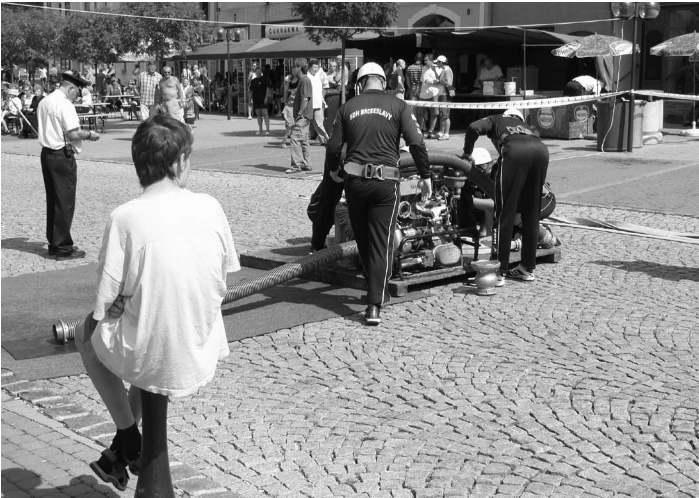
VIII. ročník soutěže hasičských družstev „O pohár města Kralovice“ proběhl na kralovickém náměstí v sobotu 25. srpna. Černé mraky na obloze před začátkem klání nevěstily nic dobrého, ale počasí se rychle umoudřilo a slunečné odpoledne přispělo k úspěšnému průběhu pořadatelů tradičně pečlivě připravené soutěže. Zúčastnilo se 9 družstev mužů a 2 družstva žen. Prvenství patřilo mužům z Hůrek před družstvy Brodeslav a Štichovic, ženy z Brodeslav porazily své soupeřky z Babíně. Další výsledky – družstva mužů: 4. Dobříč, 5. Hadačka-Výrov, 6. Kralovice I., 7. Babín, 8. Kralovice II., 9. Hradecko. Na snímku hasiči z Brodeslav.