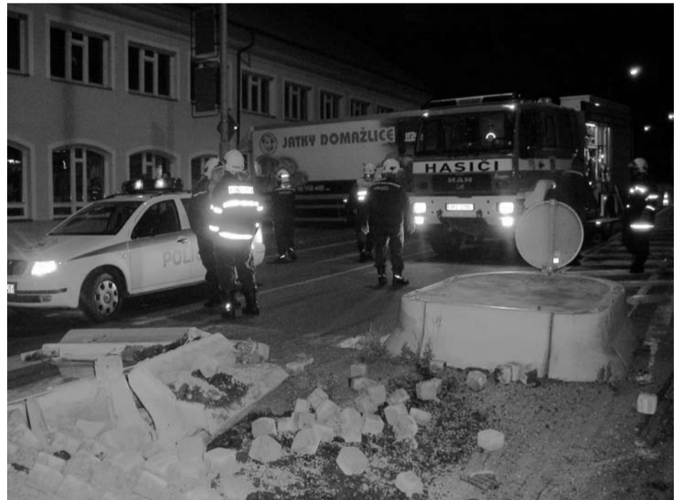
Ve čtvrtek 16. srpna zasahovali kralovičtí hasiči u dopravní nehody v Kralovicích na křižovatce na Kožlany.